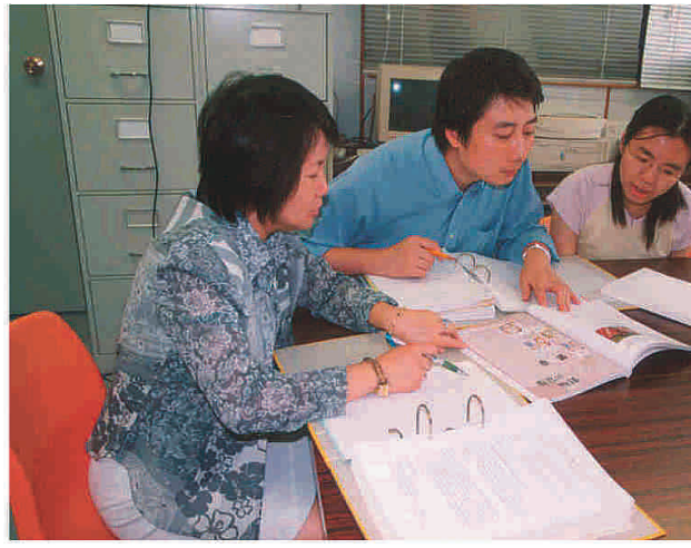
老師於空堂時間備課

由於課節的時段長了，教案的編寫有助老師重新思考課堂活動的編排。為了鼓勵老師，校方特設以下獎項：本科知識傳達、最有效演繹及互動學習等三類教案編寫獎項，以茲獎勵。