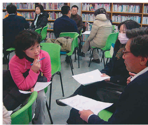
各參與工作坊的老師互相交流心得