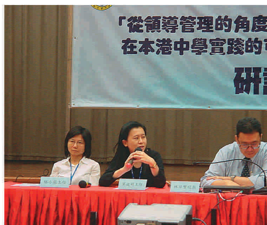
校長及老師分享推行的成果