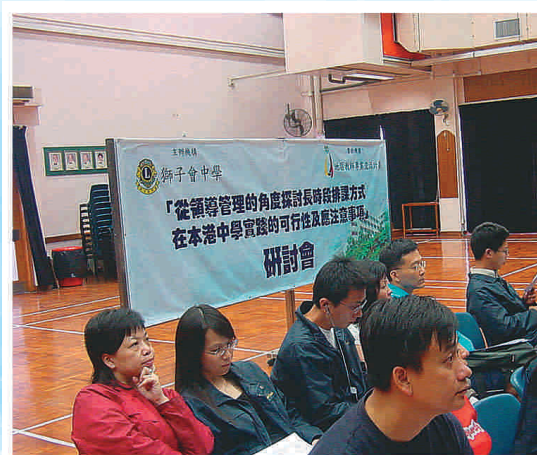
學界同工專心聆聽研究成果