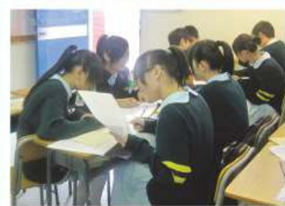
同學正進行分組討論

本科的課堂活動多元化，科任老師會選取適當的課題進行專題研習，鼓勵同學多閱讀、多討論及多思考，從閱讀中學習，從討論及思考中訓練同學處理簡單的發揮性問題，提高同學的學習興趣、溝通能力及促進人際間的交往，並訓練同學成為有責任感的人。