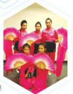
同學的扮相維肖維妙，舞姿優美，難怪奪獎無數