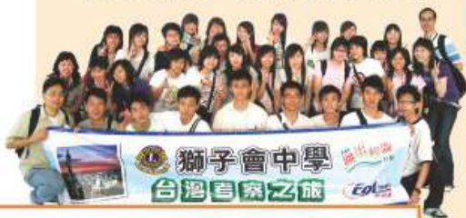
旅遊與旅遊業科舉辦之台灣考察之旅 2006