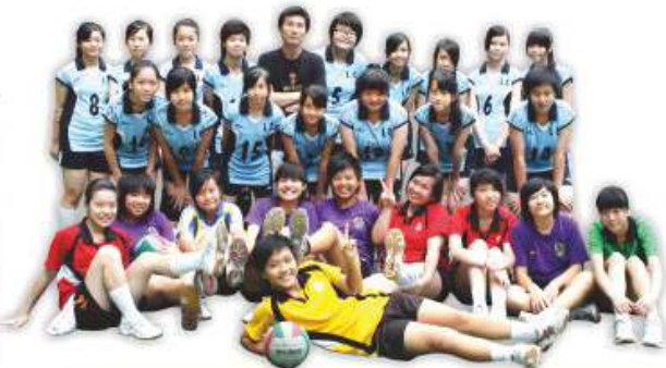
於2010年，本校獲得第二屆獅子盃排球邀請賽冠軍