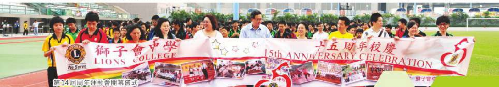
第14屆周年運動會開幕儀式