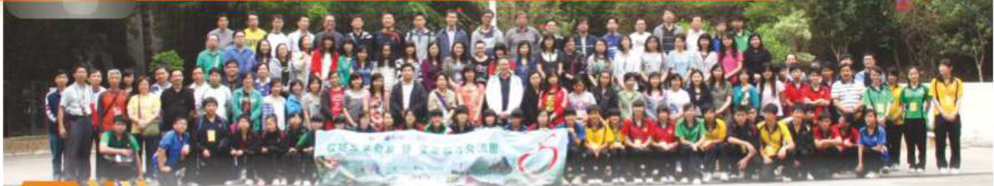
出發前，林校長與參與活動之師生來一張大合照