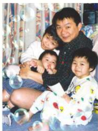
同學參加「和諧家庭」攝影及數碼平面設計比賽，榮獲亞軍之作品

本會於集會及活動中主要教授基本攝影及錄影技巧，使會員能掌握基本技術後，能慢慢對攝影及錄影產生興趣，進而開始欣賞攝影藝術。近年，本會每次之集會，往往集中於其中一項攝影技巧作為會員練習之重點，例如：淺景深、慢快門，讓會員通過反複實習，以掌握有關技巧。此外，通過學習攝影及錄影之取景、構圖、顏色的配搭、深度，可以啟發會員對攝影藝術之觸覺及對事物之觀察能力。