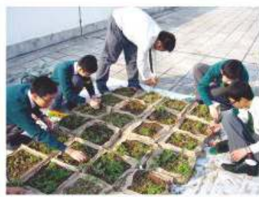
同學參與天台綠化活動

學會會員每年參加不同類型的活動，包括參觀「香港花卉展」及「香港綠化資源中心」、參加由康樂及文化事務署舉辦的「一人一花」活動及由匡智會舉辦的「全港中小學天台綠化比賽」等。這些活動能讓同學有機會透過實踐和觀察，加深對植物的認識，從而培養對種植的興趣。