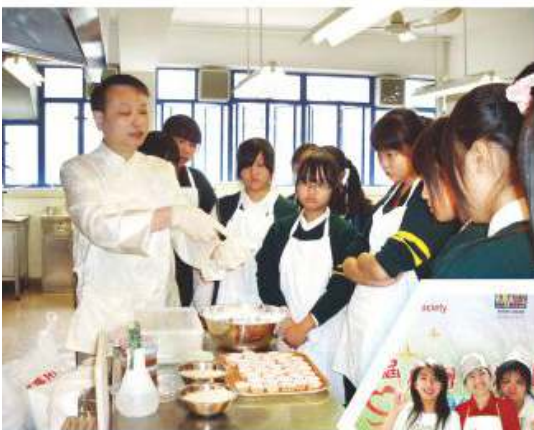
本會邀請嘉賓到校為同學講解烹飪秘訣