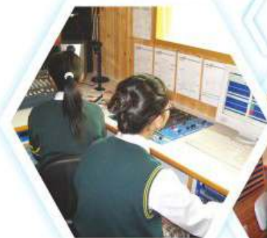
節目製作當然少不了 一班幕後之工作人員