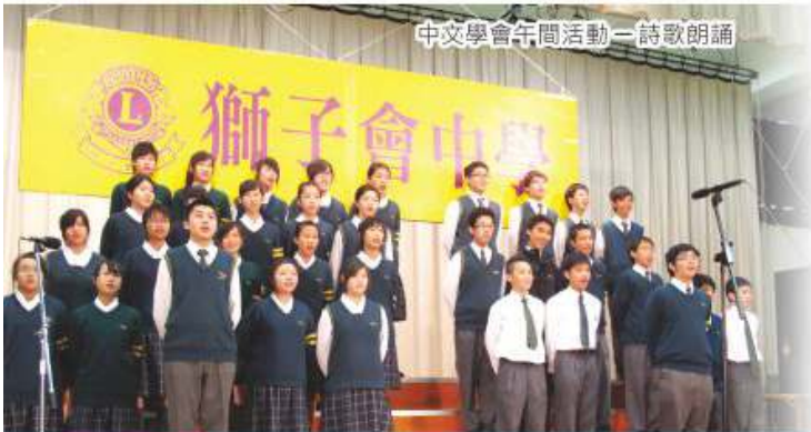
中文學會午間活動—詩歌朗誦

本學會透過活動形式引發同學對中國文化的認識、培養同學對本國文化的興趣，以及讓同學能主動地學習中國語文及文化。通過說話訓練，建立同學自信及加強其表達能力，更希望培養同學有溫柔敦厚的性情及良好的修養。本學會全年集會共10次，於第一學期，幹事會負責構思及策劃一次富趣味性之午間活動。此外，本學會更鼓勵會員參與校外各項有關比賽。