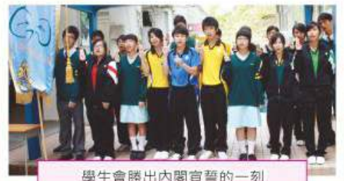
學生會勝出內閣宣誓的一刻