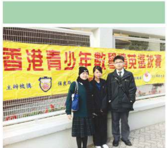
香港青少年數學精英選拔賽

為了提升同學對學習數學的興趣，並加強學同理解數學與日常生活的關係，數學科於課堂以外亦會舉辦不同與數學有關之活動，包括：跑出課室學習日、數學遊踪、數學加油站、數學閱讀計劃、數學壁報設計、數學奧林匹克小組訓練、數學專題研習(統計、日常數學的應用)、數學週及編制『數理期刊』等