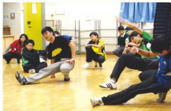
中五同學帶領一班學弟學妹練習街頭舞基本舞步