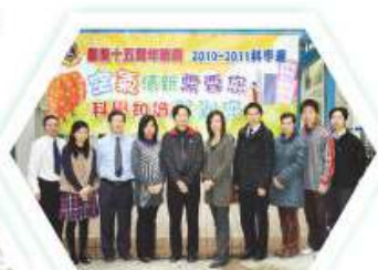
科學學習領域之成員