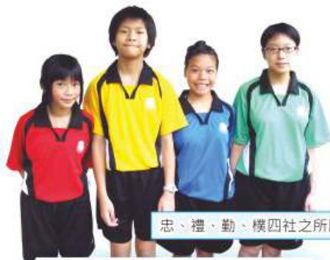
忠、禮、勤、樸四社之所屬顏色