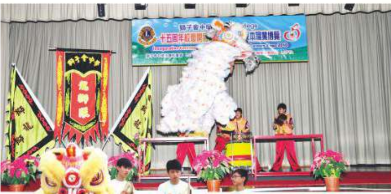
龍獅隊於校本職業博覽會當天表演

對龍獅隊來說，每一次表演或多或少的津貼報酬，可以成為隊員添置團隊制服、維修表演用具、支付運輸費用的經費來源，更重要的是可以津貼隊員聘請導師之費用，亦可以用作舉辦活動之經費，例如團年晚膳、燒烤活動及考察津貼等。凡此種種，我們希望培養同學的團隊精神及服務精神。