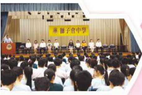
逢星期一舉行之週會

為了灌輸同學正確之價值觀及處事態度，本組為班主任課節提供不同類型之品德教育課題及時事議題教材，透過班主任引導下，同學就相關的議題進行討論及分享。此外，本組亦會安排不同班際形式之活動，例如壁報設計比賽、課室清潔比賽、「優良表現，我做得到」比賽及每月班中之最選舉等。這些活動旨在培養同學責任感，鼓勵同學追求卓越表現，並建立同學的自信，以提高其自我形象。