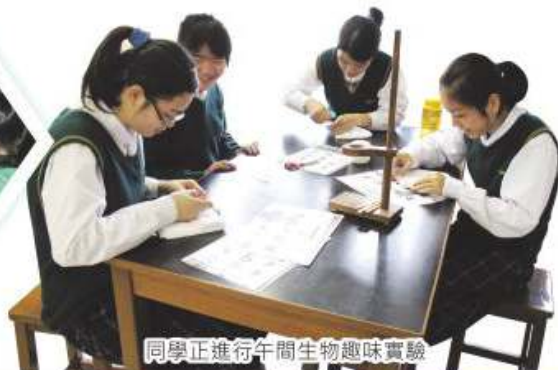
同學正進行午間生物趣味實驗