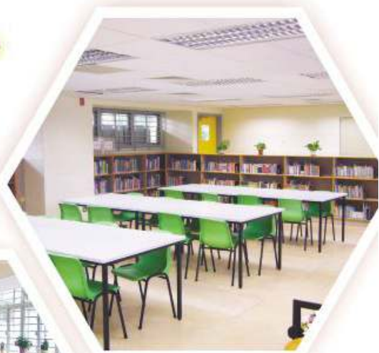
圖書館為同學提供一個舒適的閱讀環境

本校圖書館成立於1996年，以積極提供學與教的支援及提倡閱讀風氣為目標，與學校一同成長。建館初時藏書量只得3000多本，隨着學生人數漸漸增加，圖書館現有藏書已達20000多本，館藏包括中英文圖書、參考書、教師參考書、教師專業發展書刊、中英期刊及各種多媒體資料，照顧同學及教師的需要。圖書館於2004年遷往南座校舍，佔地兩層，面積比以往增加一半。館內設有電腦工作站、升學及擇業資料角、中學會考及高級程度會考試題參考專櫃，報刊閱讀區放置了沙發讓同學舒適地閱讀，在通往上層的梯間設立畫廊，定期展出學生作品。館內設有語言學習角，提供各類語言學習自學書本及視聽資料，讓同學自學。圖書館充足的空間有助發展館藏，成為多元化的學習資源中心，亦為同學提供一個理想的閱讀和溫習環境。