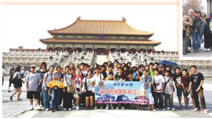
北京考察及教育交流團 2009