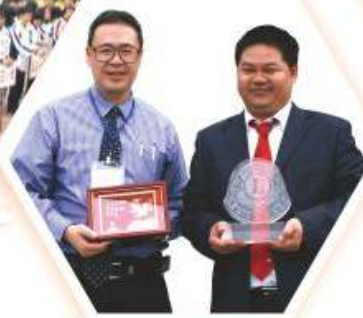
林校長與高要市第二中學黃副校長交換紀念品