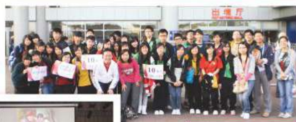
同學參加以國民教育為主題之交流活動

為提高同學之公民責任感及其國民之身份認同，本組逢星期三早上班主任節均邀請同學於心獅電台進行國情分享。於長假期裡，本組更積極籌備不同之國內考察活動，讓同學能親身感受國情，並了解祖國的最新發展。