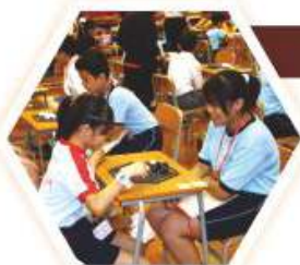
小學生眾首禮堂一較高下

本校舉辦「ABALONE 321 智力棋比賽」，增加小學生對智力棋類之認識，從而加強他們的思考能力。