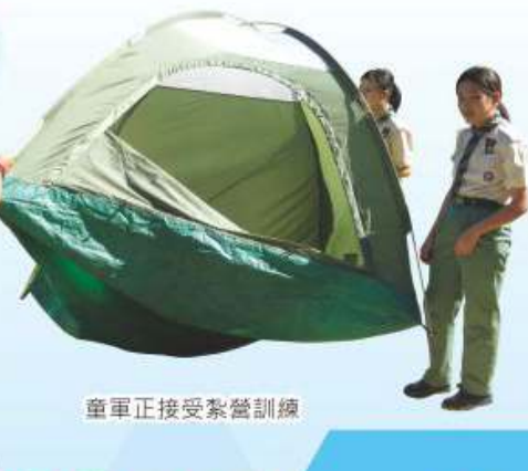
童軍正接受露營訓練