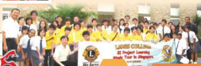
通識教育科新加坡 英語交流團 2007