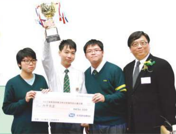
同學於 IVE 物流及時事常識問答比賽奪得冠軍

隨著新高中學制的落實，通識教育科已成為四個核心科目之一。新高中通識教育科旨在透過探究各類議題，加強同學對社會的觸覺。本科所選取的單元內容主題，對學生個人、社會和世界均具有重要意義，也能幫助同學聯繫不同範疇的知識，擴闊視野。