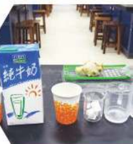
科學週活動所需材料－製作薑汁撞奶