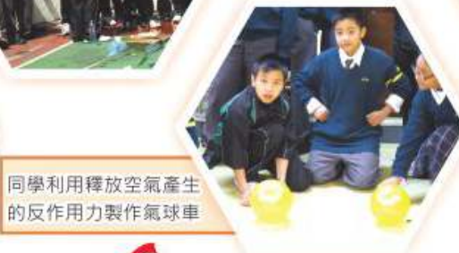
同學利用釋放空氣產生的反作用力製作氣球車