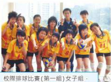
校際排球比賽(第一組)女子組，於2004年取得首個冠軍殊榮

排球隊於1996年成立，於2002年起，排球隊之比賽由第二組別晉升為第一組別。球隊非常重視技術、體能、紀律及團隊精神等方面之發展，並期望每位隊員會以成為獅子會中學排球隊隊員為榮。球隊多年來於葵青區(第一組)女子組保持著前列之位置，連續3年獲得葵青區校際排球比賽(第一組)女子組總冠軍；於2008-2009年度，更擊敗多支傳統排球勁旅，獲得全港排球精英賽亞軍。為保持高競賽水平及與其他區分學校建立友誼，排球隊於2009年首辦了第一屆獅子盃排球邀請賽。