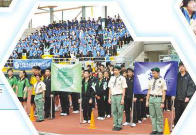
四社運動員代表於周年運動會開幕典禮進場