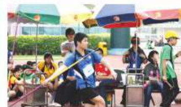
同學於周年運動會一展身手