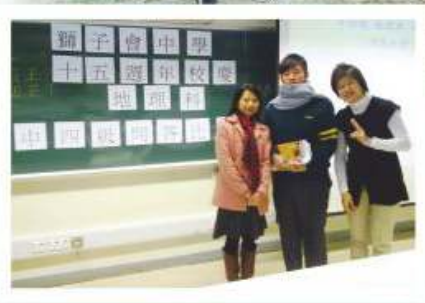
級際地理問答比賽