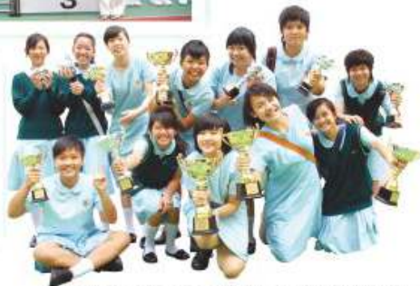
2009至2010年度葵青區校際比賽頒獎禮