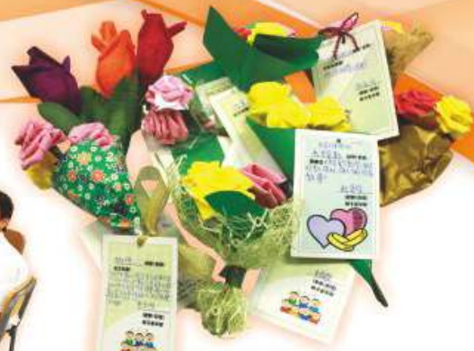
花束附以心意咭，是同學向小學老師表達謝意的最好方式。