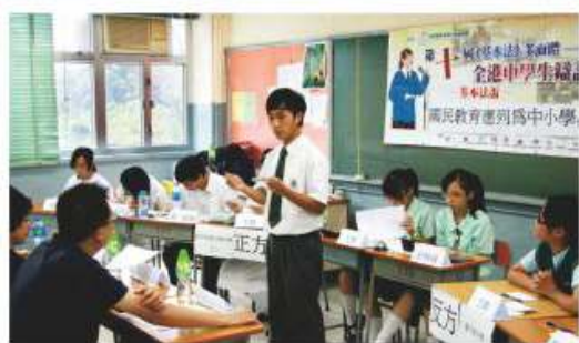
第10屆基本法多面體 — 全港中學生辯論賽