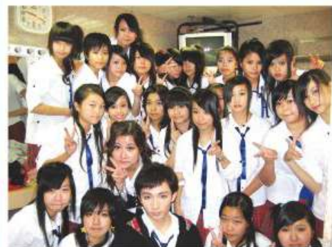
爵士舞學會之成員