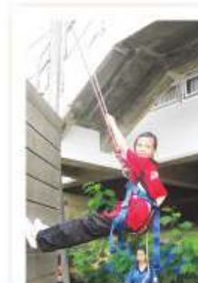
中一級之歷奇訓練活動

共創成長路計劃宗旨是透過培育同學不同的潛能，確認其能力，並加強與他人的聯繫，以及建立健康的信念和清晰的價值觀，以促進同學全人發展。本計劃之對象為初中同學。計劃包括培育課程及培育活動兩個層面：培訓課程由班主任與香港青年協會社工合作進行；培養活動則由香港青年協會負責籌劃，主題包括中一級之歷奇訓練、中二級之服務學習及中三級之夢想成真計劃。