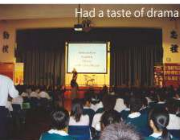
Had a taste of drama