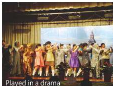
Played in a drama

Drama and popular culture are adopted as viable parts of the S.2 and S.3 curriculum. This is not just restricted play-acting and watching television, but the kinds of drama and popular culture that involve a variety of ways students