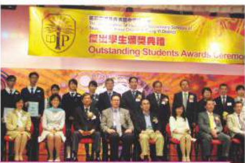
荃葵青中學校長會第20屆傑出學生選舉

本組一向鼓勵同學參加不同類型的獎勵計劃，包括尤德爵士紀念基金、蘋果日報慈善基金、獅球教育基金、荃灣葵涌及青衣區中學校長會傑出學生獎、葛量洪獎學金、獅球教育基金傑出學生選舉、仁濟初中學生最顯著進步獎勵計劃等。