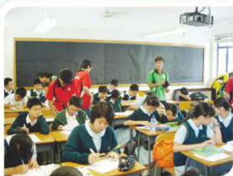
同學就濕地公園考察活動進行 事前之準備工作

本學習領域於未來會繼續透過多元化學習，提升同學的共通能力，亦繼續要求同學多接觸時事、多作多角度思考，並善用文字表達自己的意見，好好裝備自己，以應付社會的不同挑戰。