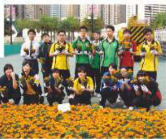
同學參與香港花卉展學童鑲嵌花壇活動