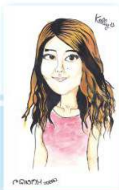
同學之人像繪畫作品

近年，教育局將視覺藝術課程改革，鼓勵同學作多元化之嘗試，有見及此，視覺學會於本年推行了四項活動，分別為插花、漫畫創作、皮革製作及塗鴉，並聘請專業導師教授同學有關技巧，同學都踴躍參加，反應理想。