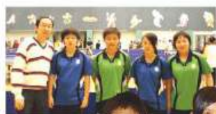
本校乒乓球隊之精英

每年乒乓球學會均會安排同學參與學校體育聯會舉辦之葵青區乒乓球比賽。多年來，同學之比賽成績優異，屢獲殊榮。