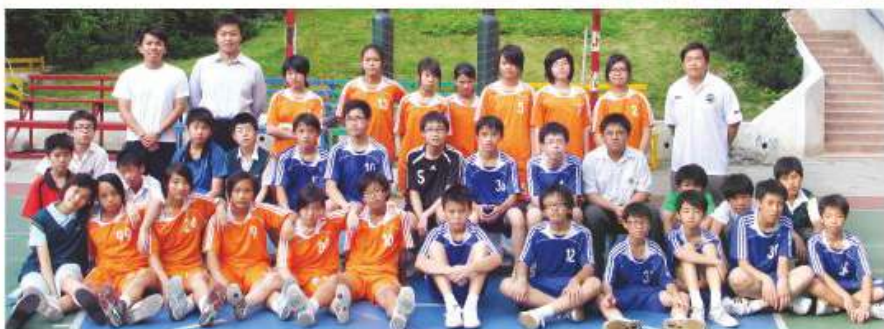
本校手球隊之精英