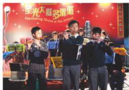
本校同學於「星光大道多璀璨」表演環節中演出

本校設有多個樂器班，包括電子結他班、流行鼓班、鍵盤班和古箏班。希望透過舉辦各樂器班來提升同學對音樂之興趣，並讓同學有更多機會參與音樂活動。凡表現突出者，均會被老師推薦參加一年一度的香港學校音樂節比賽或本校中樂團。令人鼓舞的是，凡被老師推薦參加之同學，亦取得優異成績。