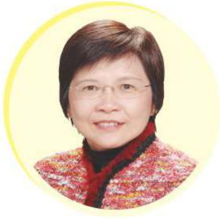
商務及經濟發展局局長劉吳惠蘭