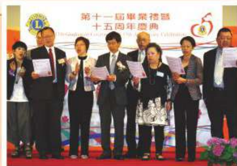
校董們之獻唱，為15周年校慶典禮掀起高潮