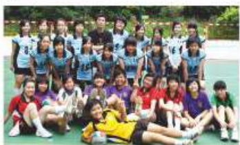
本校女子排球隊成員

藝術教育方面，為同學提供均衡之課程，讓他們得到全人教育。於「教育統籌委員會」所制訂之教育目標中，藝術教育是五育之重要一環：「讓每個人在德、智、體、群、美各方面都有全面而具個性的發展，能夠一生不斷自學、思考、探索、創新和應變。」我們深信，本範疇透過藝術學習讓同學發展其創造力、想像力、靈活、審美能力等素質，並懂得評賞外界事物，從而建立正確之價值觀和態度，以及繼承、發揚及反思本土及其他文化之傳統和價值。