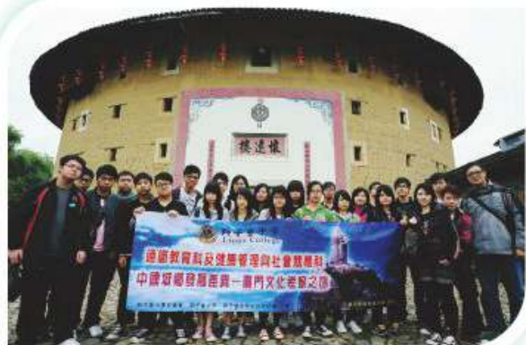
中國城鄉發展差異－廈門文化考察之旅

獨立專題探究乃新高中通識教育科不可缺少的一部分，同學透過對議題及問題進行探究性的研究，有助發展其高階思維能力和溝通能力。同學為自己的學習訂立目標、擬定計畫、落實計畫和解決問題的過程中，成為自主的學習者。