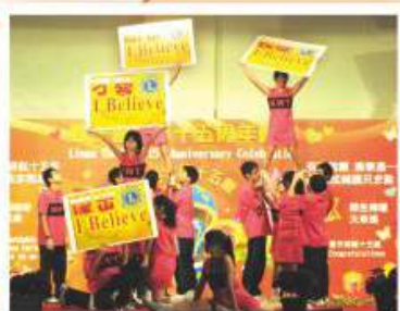
本校啦啦隊於校慶典禮當日進行表演

本校「第11屆畢業禮暨15周年慶典」於2011年5月27日下午圓滿舉行。典禮恭請了國際獅子總會中國港澳303區譚鳳枝總監、國際獅子總會中國港澳303區前總監兼獅子會中學創校校監周振基博士（SBS JP）及教育局荃灣及葵青區總學校發展主任林漢荃先生蒞臨主禮。頒獎儀式後，同學進行了一連串之表演，包括啦啦隊、樂隊演奏、歌詠團獻唱、英語綜合表演及歌舞劇等。嘉賓對各項表演讚不絕口，典禮於一遍歡樂氣氛中結束。