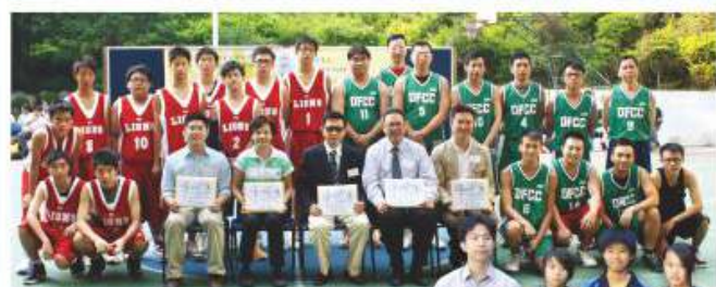
男子甲組與警察隊進行友誼賽