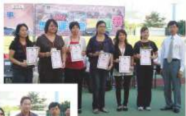
家長教師會於就職典禮中接受委任狀

家長教師秉承上述各項宗旨，多年來深得家長們支持，與教師們攜手舉辦了各項活動，包括：舊書寄售活動、燒烤晚會、親子旅行、作家講座、內地交流團等活動。此外，本會更設立緊急援助基金及活動基金，供家長及教師申請，基金的目的主要是支援與同學相關之工作。近年，我們致力推動家長義工，發動家長參與服務行列，讓家長於參與服務中體驗助人自助的精神。在家校交流方面，我們一向致力與學校各持分者共同促進溝通，家長教師會不時與學生會、班代表、學校各相關小組舉行聚會，共同探討彼此關心的議題，如新高中學制、語言微調及學校訓輔工作等。