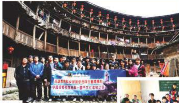
通識教育科舉辦之中國城鄉發展差異－廈門文化考察之旅 2010