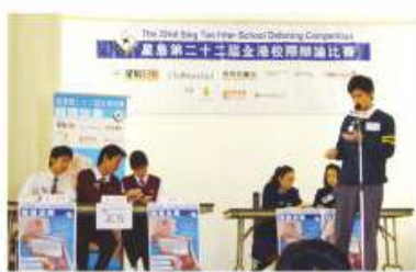
星島第22屆全港校際辯論比賽