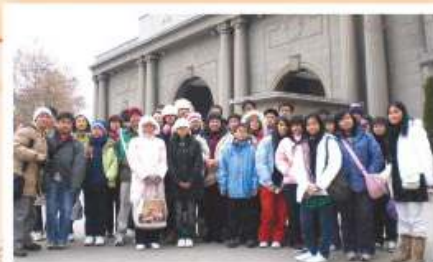
南京大屠殺 70 周年 — 南京考察團 2008