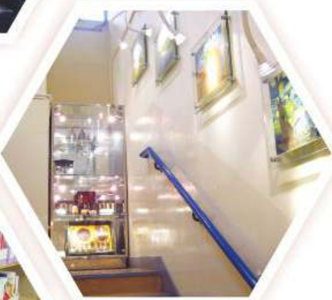
梯間畫廊，定期展出學生作品