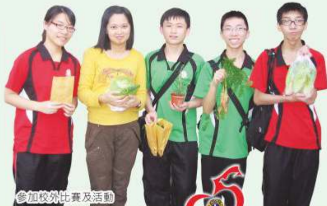
參加校外比賽及活動

我們希望能應用生物學的知識及技巧於日常生活中，並向他人宣揚尊重生命、愛護環境的重要，讓世界更美好。