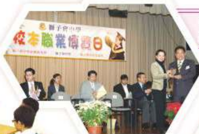
校本職業博覽開展禮，校監致送紀念座予各位主講嘉賓