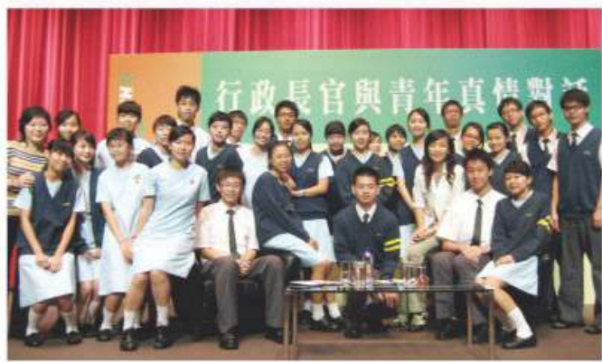
與行政長官進行真情對話