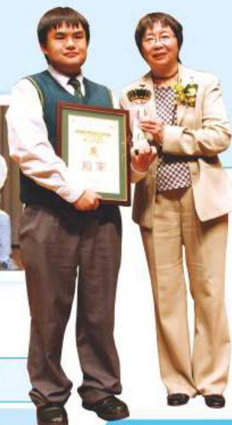
同學於普通話戲劇比賽中領獎