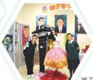
獅子會中學舉辦之藝術展覽