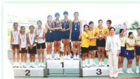
獅子盃小學友校 接力賽優勝隊伍

體育科之學與教方法和其他學科截然不同，體育科均透過身體活動之過程來進行教育，以達致體育相關之目的。同學透過體育活動，學習應有之技能和知識、培養審美能力以及各種共通能力，確立正面的價值觀和態度，並增強身體素質。透過多元化之體育活動，提高同學對參與校內及校外舉辦的體育活動之積極性。體育科均著重培訓初中有運動潛質之同學，給予適當機會以發揮其潛能。體育科亦著重培訓高中同學之組織及領導才能，以及建立其與人合作之正確態度。