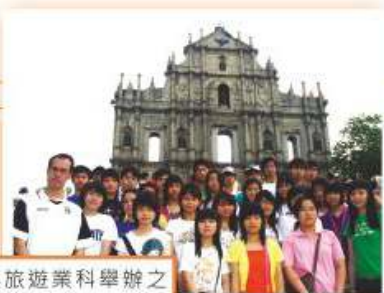
旅遊與旅遊業科舉辦之 澳門旅遊業考察團 2005

通識教育科、健康管理與社會關懷科及旅遊與款待科，亦不時會因應學科需要舉行不少考察團，其主要目的是提升同學的學習興趣，增強同學的學科知識。