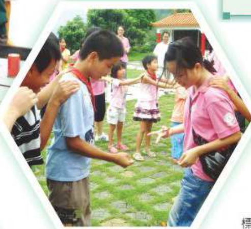
修讀旅遊與款待科之同學於交流活動中，與國內小學生打成一片

本學習領域之教師訂定了清晰之學習目標和重點，採用合適之教學策略，為同學提供所需之學習機會和環境，協助同學掌握所學、啟發思考，並引發和維持他們之學習動機和興趣。本學習領域每年均安排適量和有意義的全方位學習活動，及選取恰當之學習材料和內容，並妥善布置環境和運用適當之資源，如教科書和資訊科技等，同學均獲得真實而豐富之學習經歷。