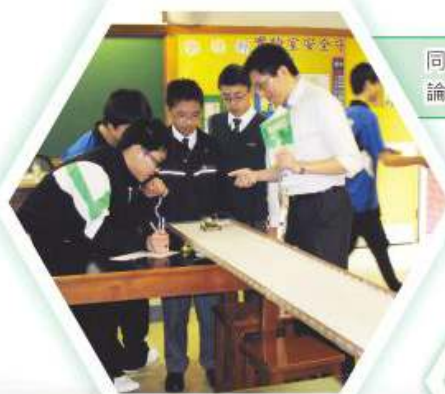
同學運用物理理論自製風力車

本科之課程內容非常生活化，主要通過分組實驗，使同學認識簡單之研究科學技巧，並適當和安全地使用科學儀器，從而訓練同學分析資料及作出結論，最終幫助同學掌握抽象之科學概念及把科學應用於日常生活中。