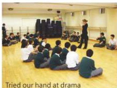
Tried our hand at drama

learn and use the language. They can explore English diction, intonation, rhythm and free speech. We believe Language Arts can also develop students' creativity, performance technique and sense of co-operation so that they can interact in English outside the classroom with confidence.