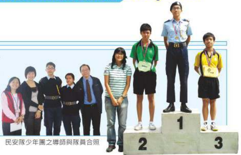
民安隊少年團之導師與隊員合照

民眾安全服務隊少年團簡稱「民安隊」隸屬香港民眾安全服務隊，組織規模完善，活動亦多元化。本隊隊員所有訓練均由香港民眾安全服務隊總部負責。民安隊希望隊員通過參與民安隊少年團之訓練，培養自律能力、責任感，並透過參加服務活動，培養同學的自信心及領導才能；通過參與步操訓練及社會服務，加強隊員之紀律性，並貫徹本校「我們服務」之精神。