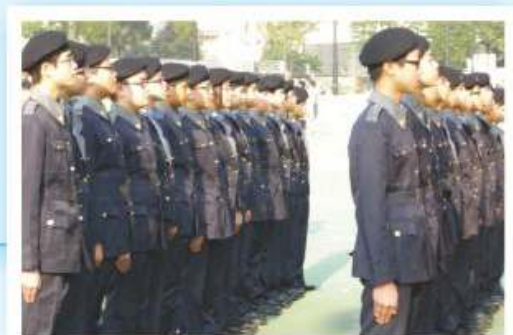
獅子會禁毒先鋒隊隊員正進行步操練習