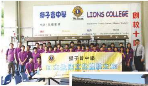
旅遊與旅遊業科舉辦之日本生活文化體驗之旅 2008