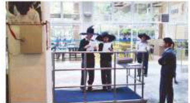
"English Today" – one minute English sharing in morning assemblies