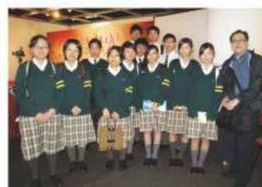
同學參觀五四運動圖片展覽