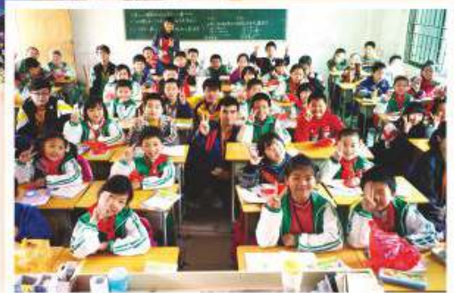
通識教育科及健康管理與社會關懷科合辦之東莞民工子弟服務學習活動 2011