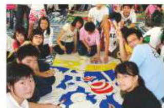
同學正繪畫大型水彩掛畫