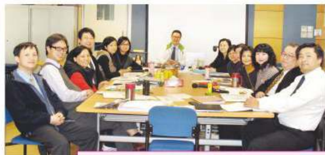
本校課程發展及評估委員會成員