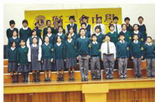
中一級同學正為香港校際朗誦節比賽進行練習

展望未來數載，面對新高中學制的改革、課程的革新，雖然語文老師的工作將更為繁重，但是，本學習領域的老師定必以「任重道遠」的精神緊守崗位，在總科主任及科主任的領導下，貫徹學校的使命及抱負，順應時代的發展，向本校同學提供優質的語文教育，致力培養同學成為有良好兩文三語基礎的公民，為教育下一代而盡心盡力。