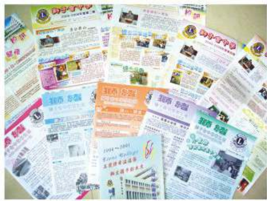
於15年裡，本學會出版過之刊物多不勝數

學生刊物之使命是將校園動態作全面報導，讓同學於參與編製報刊之過程中，對學校的活動、比賽有更清楚之認識，並為同學提供渠道向校方反映意見，從而增加歸屬感。學生刊物每年均出版《獅緒》及《校訊》，本年更有幸能協助出版15周年特刊，以垂永紀。