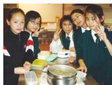
同學們享受製作食物的樂趣