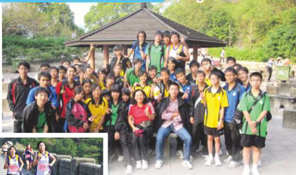
本校越野隊之精英

越野隊成立之目的是希望提升同學之體適能、耐力及意志力，並促進身心發展。於訓練時，我們強調同學要跑得輕鬆協調，身體重心平穩，並有良好的節奏，還要盡量提高肌肉用力和放鬆的能力。經過一段時間之訓練，同學的體能有明顯之進步。每年，本校均有多名同學代表學校參加葵青區越野比賽及其他越野比賽，隊員之成績令人滿意。