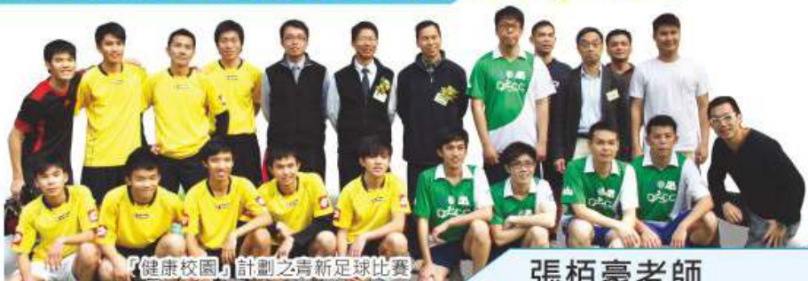
「健康校園」計劃之青新足球比賽

女子足球隊之表現可謂不相伯仲，雖然女子足球隊於2007至2008年度才正式成立，但於短短幾年時間，在隊員的努力下，已成為全港學界女子足球隊之新勢力。本年度更連續兩年成為全港亞軍，兩次決賽都是敗於11連冠之賽馬會體藝中學腳下，可說是雖敗猶榮。而各隊員更已定下目標，期望於下年度能打破對手多年不敗之紀錄。