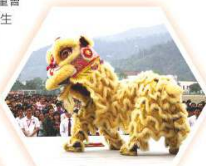
本校龍獅隊同學於高要市第二中學全體6000名師生前表演獅藝