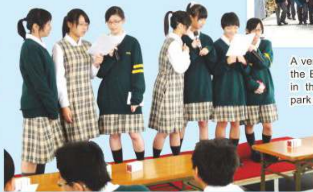
The Christmas celebration was held in the covered playground and students enjoyed singing carols and playing with the decorations, so colourful!

The English Club conducted many social events to give students exposure to activities from western tradition as a way of experiencing the activities and thereby learning communicative language. Students enjoyed the "Trick or treat" of Halloween, the "Roses are red, violets are blue, you love me and I love you" of Valentines day as well as the "could I please have a bubble tea and a pizza" at the Deli Francaise Afternoon Tea event.