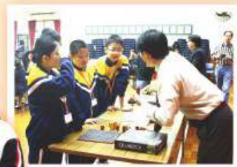
小學學生於數學遊踪比賽表現積極