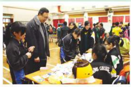
營商計劃之推行實況