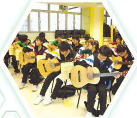
結他班同學正努力練習