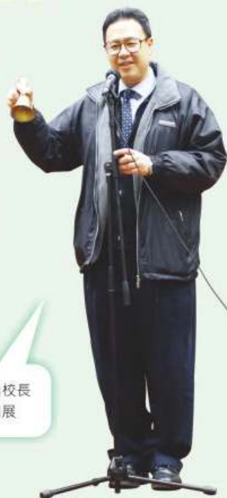
營商計劃由校長宣佈正式開展

為了讓同學生於真實之商業情境中實踐所學，本科舉辦了營商計劃，讓同學透過籌劃及實踐汲取經驗，並從中學會與人合作及解決困難之技巧。同學須就自己的角色或職務訂定目標及具體的行動計劃，然後施行有關計劃，最後進行相應之檢討。活動過後，同學能更清楚了解商業之運作，相信對同學於日後從事相關工作方面，有莫大的幫助。