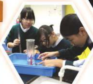
同學進行氧氣測試實驗