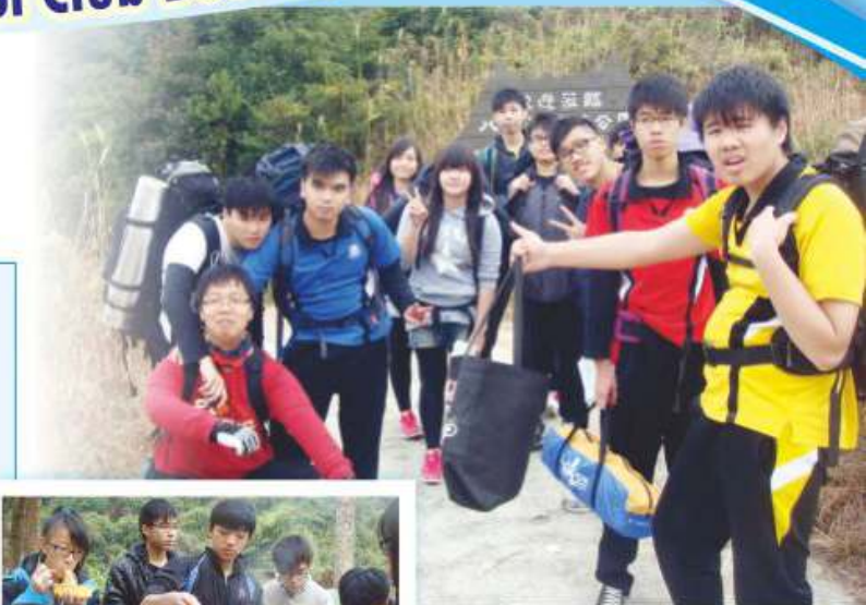
同學正進行遠足訓練

獎勵計劃是以章級制進行，分銅章、銀章及金章。同學必須完成野外鍛鍊、技能、康樂體育及服務等活動，在表現理想之情況下，方能達致考取不同章別之要求。香港青年獎勵計劃是一個充滿活力，可為同學帶來挑戰及滿足感之課餘活動，整項計劃同時亦能配合新高中課程中其他學習經歷的需要。