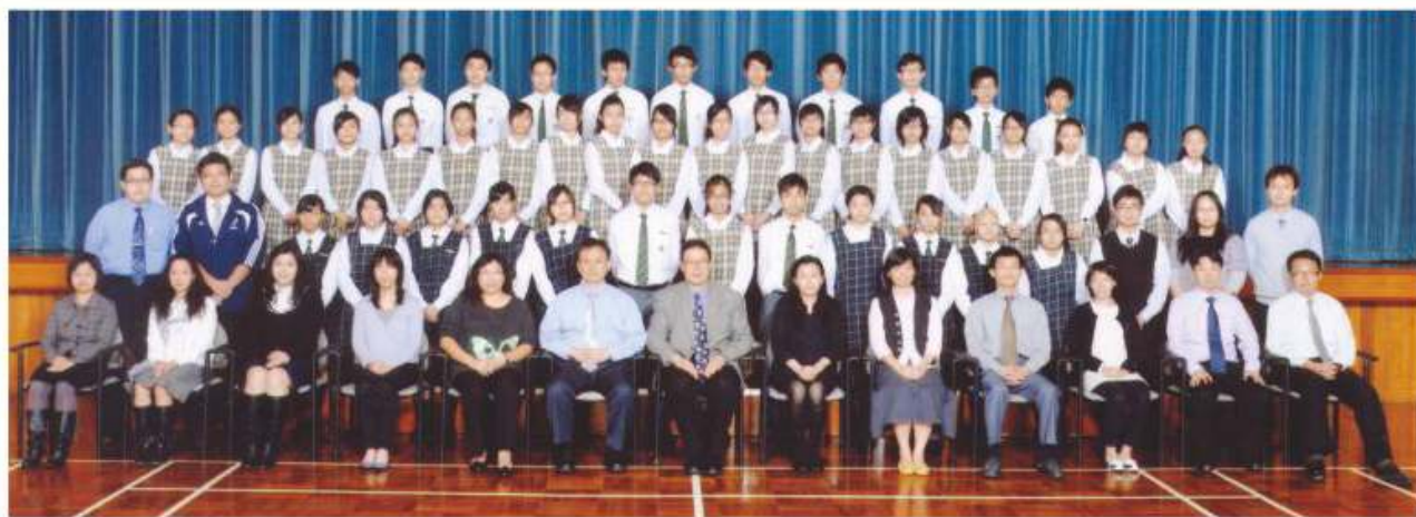
本學年之領袖生及訓輔組老師