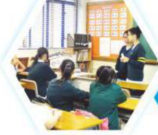
中文學會集會情況