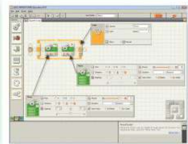
同學利用 Lego NXT學習編寫程式之概念

本校初中同學均須修讀電腦與設計科，而高中同學則可選修資訊及通訊科技科。同學於電腦與設計科，除了學習有關資訊、通訊及電腦系統之基本知識、概念及應用外，更培養成為能幹的、有效率的和有自信的資訊及通訊科技的使用者。資訊及通訊科技旨在發展同學解決問題及提升其溝通能力，以鼓勵同學培養批判性思考及創意思維，從而，不但有效地分辨資訊，而且具有道德地使用資訊及通訊科技，藉以支持他們終身學習，以及提供機會讓同學親身體會資訊及通訊科技對知識型社會所帶來的影響，最終培養同學的正面價值觀和積極態度。兩科之課堂均著重理論與實踐，並著重培養同學之邏輯思維，使其有系統地處理及分析問題，從而把知識及技能轉移到日常生活當中。