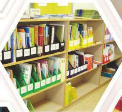
升學及擇業資料角

閱讀是一個思維旅程。從書本的序言到結語，箇中的樂趣、感受與得著，若能與人分享和交流，這個旅程變得更為豐富，更有意義。為了讓同學有更多機會分享閱讀的樂趣，圖書館成立「悅」讀會，鼓勵同學積極參與和別人分享閱讀心得。活動形式是透過輕鬆愉快的小組討論，讓同學藉此增加溝通和分析能力，並培養終身閱讀的好習慣。另外，圖書館製作「好書介紹」節目，每週在校園電台一心獅電台播放，讓同學及老師在大氣中分享閱讀樂趣。圖書館亦推行「學生圖書回購計劃」，讓同學按自己能力及興趣購買喜愛的閱讀材料，閱讀後與同學分享，圖書館便會購回同學所購買的圖書，計劃可發揮朋輩影響力，推廣閱讀文化。透過「導師制全接觸—閱讀分享」活動，鼓勵導師與大哥哥大姐姐向中一級同學推介圖書，互相分享閱讀心得，一同享受閱讀樂趣。