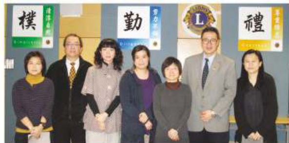
本校學與教事務組成員

本校多年前已推行70分鐘課節時間表架構，讓教師有充足時間實踐教改新理念外，更能讓同學在靈活的選科組合機制下，按其個人的能力和興趣選科，致使學校整體會考成績持續進步，而高考成绩更逾8成半科目之合格率高於全港公開考試合格率水平。