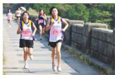
本校越野隊隊員於城門水塘參與葵青區越野比賽