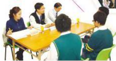
同學分組進行校內模擬面試比賽