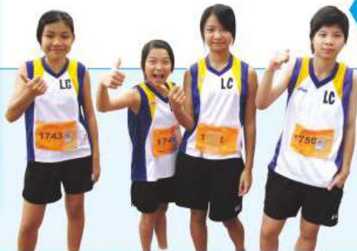
本校田徑隊之精英

田徑隊的宗旨是提升同學對田徑運動的興趣及水平，每年我們也有多位同學參加外展(聯校)田徑訓練課程之基礎課程，由專業導師訓練，提升自己的田徑技術水平，當中也有很多同學被挑選參加校際賽、區際賽及全港賽，同學們多年來也獲獎無數。希望同學能繼續努力，發揮自己潛能，創造更好的成績。