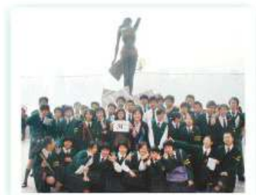
Language Exposure Day – "The five tourists I met at the Avenue of Stars"

Having a vision of English Language as a living language not a dry academic subject, providing our students with further opportunities for extending their knowledge and experience of the cultures of other people as well as opportunities for personal intellectual development, further studies, pleasure and work in the English medium will always be our mission.