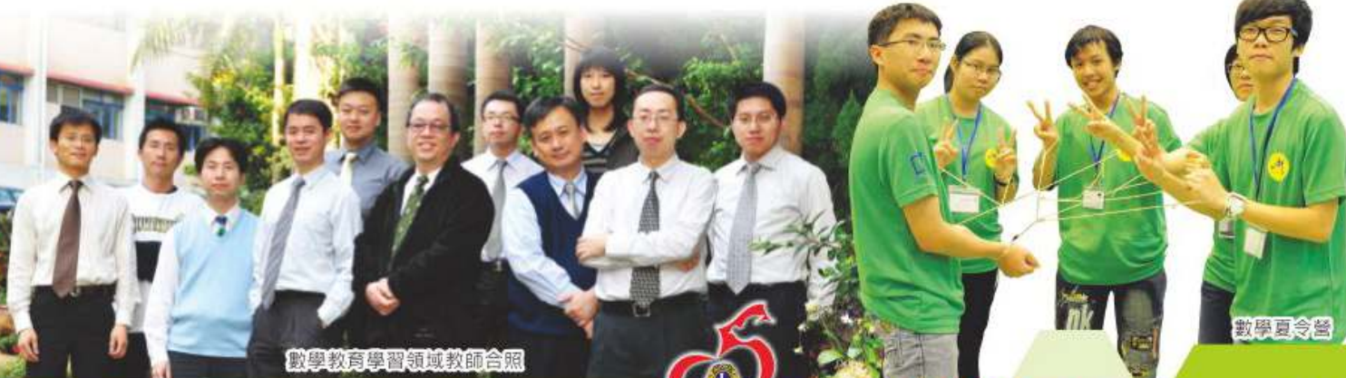
數學教育學習領域教師合照