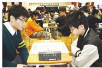
第一屆獅子會盃象棋比賽