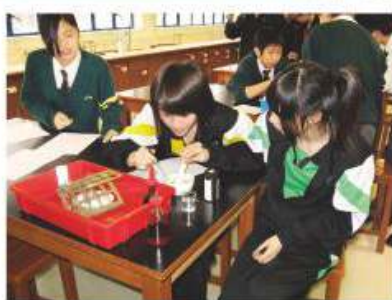
同學於實驗室進行科學實驗

組合科學科是新高中課程之其中一選修科目。本課程旨在為同學提供與科學相關的學習經歷，本課程是為在科學教育學習領域中選修兩科（化學及生物）的同學而設計。