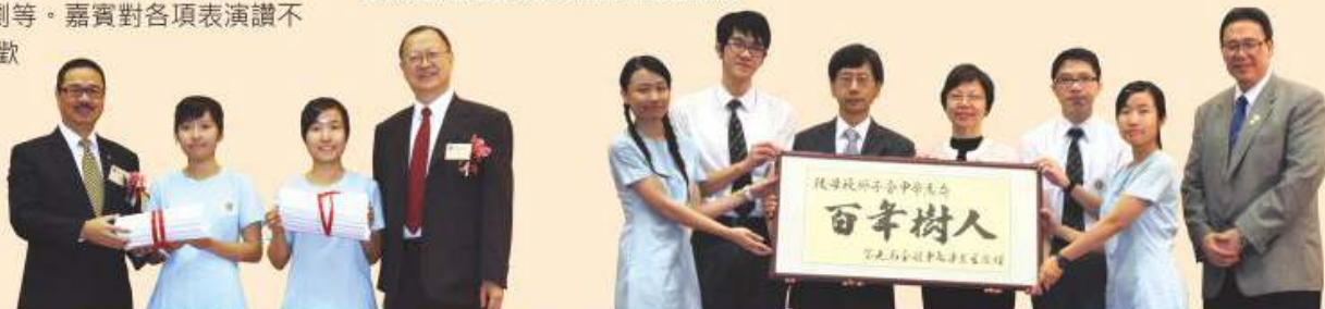
中七級畢業班代表獲主禮嘉賓頒發畢業証書