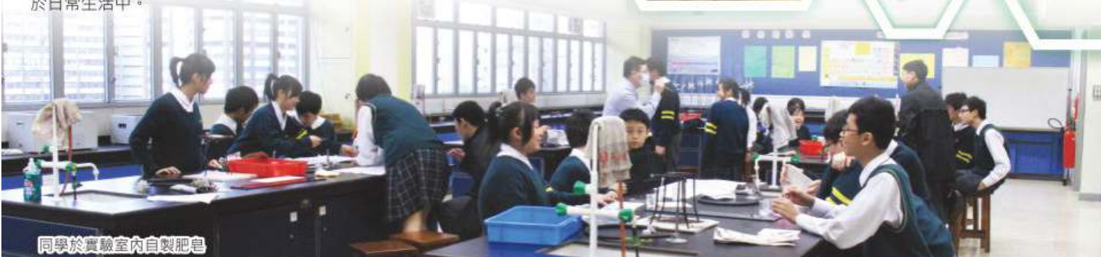
同學於實驗室內自製肥皂