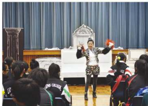
同學正進行話劇欣賞