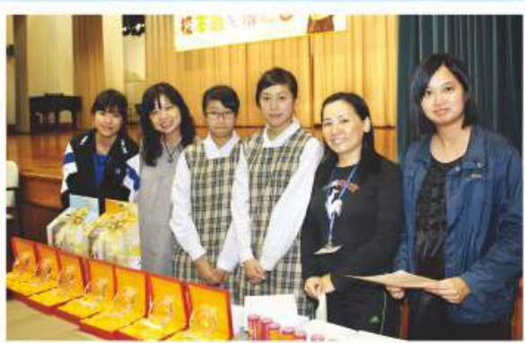
同學協助老師籌備大小不同之典禮

同學參與本組後，導師會為同學提供一些訓練課程，亦會在儀容、儀態方面多加提點，使同學在充滿自信下擔當校內比賽、典禮之司儀。另一方面，導師會積極鼓勵同學參加有關演講、演說的比賽，以增強自信。