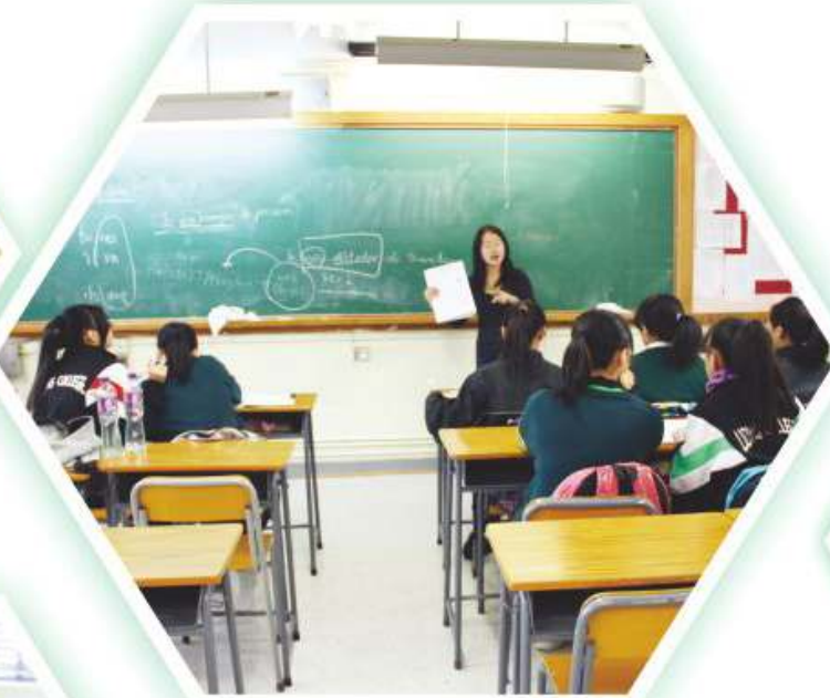
同學學習法語的情況