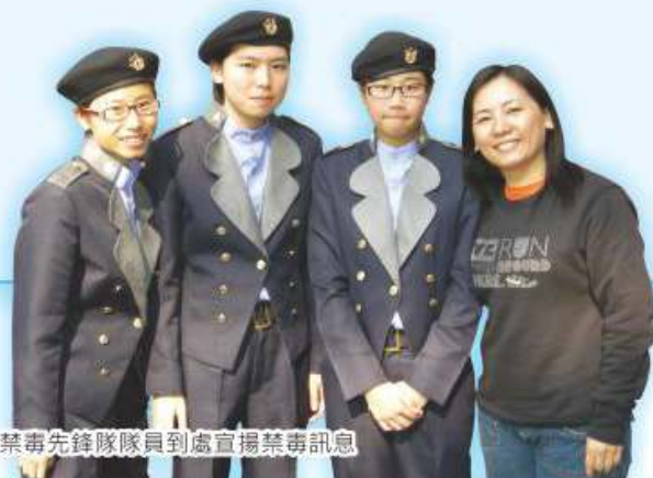
獅子會禁毒先鋒隊隊員到處宣揚禁毒訊息

「獅子會禁毒先鋒隊」成立了兩年，會員人數達50人，隊員積極參與各項有關禁毒之服務，如到各區宣揚抗毒訊息、參與Now TV新聞台有關禁毒之節目錄影、參與香港電台「訴心事家庭」節目錄音。此外，隊員亦積極舉辦推廣健康訊息之活動，如於校內舉辦「禁毒周」—抗毒論壇、抗毒展覽及抗毒廣播劇等。