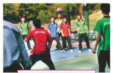
學生會舉辦之活動