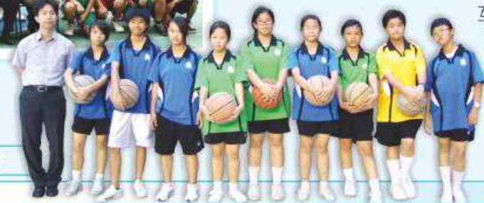
本校之女子籃球隊

籃球隊成立旨在提高同學之籃球技能，以及提升同學之體適能，並培養同學之體育精神，從活動中學習朋輩間相處之道，並互助互愛。隊員在教練之悉心教導下，不論是球技上和品格上皆較往年進步。每年學校均參加葵青區學界比賽和其他籃球比賽，隊員都能全情投入，並悉力以赴。希望於未來之各項比賽，籃球隊能繼續為校爭光。