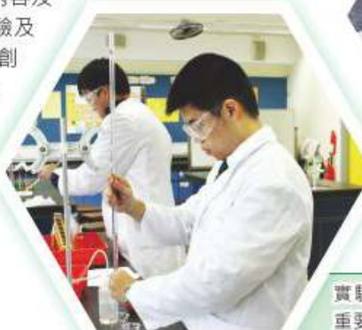
實驗課是學習化學科重要的環節