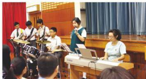
本校樂器班於禮堂進行表演

本團主要透過練習及活動以增強同學的自信心。本團特色乃會作基本的樂器訓練以組織樂團，透過參加不同的比賽、校內校外的演出以提升其音樂造詣及信心。此外，我們亦會透過欣賞不同的校外演出來讓同學增加演出經驗，有所裨益。