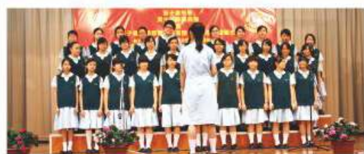
合唱團於畢業禮演出