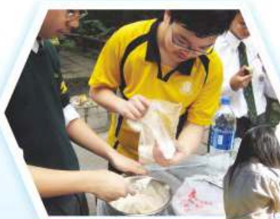
童軍正接受烹飪訓練

本校童軍團於1996年9月成立，屬於新界地域南葵涌區第13旅，於1999年更成立深資童軍團。本學會按香港童軍總會的訓練綱要，提供步操、原野烹飪、遠足、露營技巧等訓練，目的是提高團員間之團隊精神、個人野外求生技能等。同學有機會透過考取童軍進度性獎章及深資童軍獎章，培養自己成為一個有自立能力、樂於助人、有責任感及勇於承擔的人。