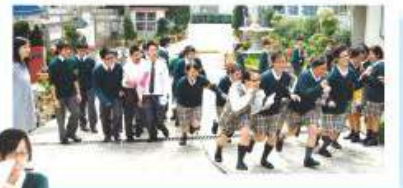
A very popular event was the Easter Egg Hunt held in the entrance and car park of Lions College.