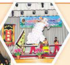
同學於開展禮當天進行醒獅表演

本校於2010年12月10日舉行「15周年校慶開展禮暨2010年校本職業博覽」，並有幸邀請到國際獅子總會中國港澳303區譚鳳枝總監蒞臨主持開展禮。當天除了是15周年校慶開展禮外，亦是本校一年一度的校本職業博覽日。校方安排了獅友、舊生、外間機構及私營公司代表分享對其行業之發展、前景及工作環境提供專業分析，從而讓同學們對不同行業有初步之認識，以及加強同學與獅友們之聯繫。