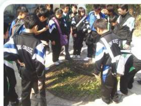
屏山文物徑考察活動