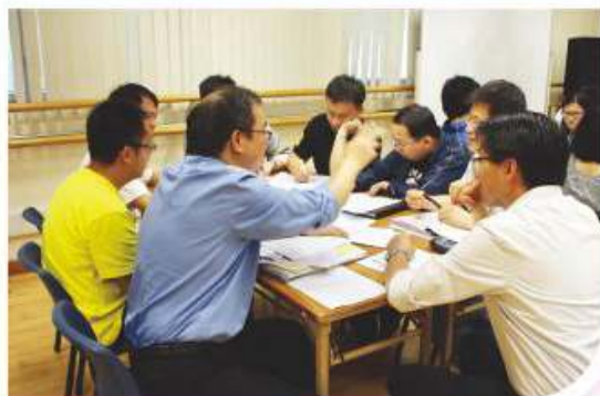
教師正討論預習策略及要求

本組本年之工作主題為「同心同德，互勉前行」，希望教師於工作上能彼此支援，共同奮進。面對教育界之急速轉變，本校教師依然緊守崗位，為同學提供優質之教育服務。故此，本組與學生事務組及學與教事務組保持緊密合作，務求對整體教師於推行學校重點工作上作出支援。