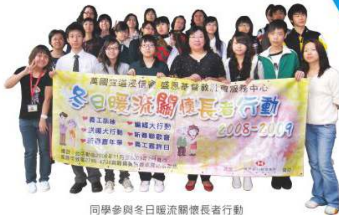
同學參與冬日暖流關懷長者行動

過去15年，同學有機會參與社區義工、清潔服務、賣旗籌款及姊妹學校義工計劃等社會服務。本校同學憑著對社會的敏銳觸覺，籌辦各類相關之義工活動。透過參與不同之社區服務，同學對社會問題有了更深入之了解，並對社區服務充滿熱誠和關懷。