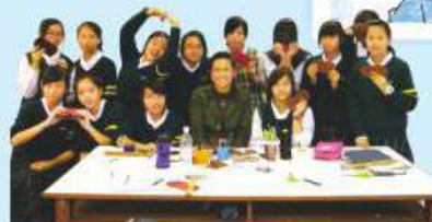
同學於專業導師指導下，藝術造詣必定有所提升