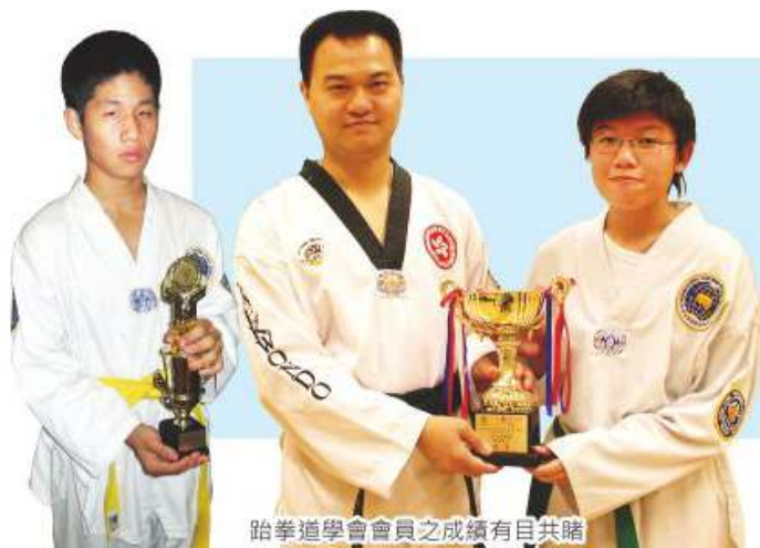
跆拳道學會會員之成績有目共睹