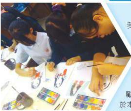
同學正專心地繪畫人像繪畫