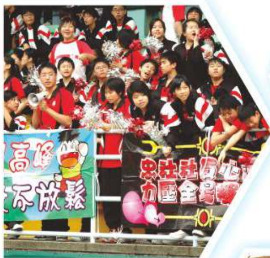
四社啦啦隊於周年運動會為健兒打氣

於架構上，各社自行組織社內閣，並選拔社員，參加各類比賽，從而加強老師與同學間之關係，亦能培養同學的領導能力及增強同學對學校的歸屬感。