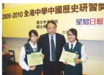
同學於全港中學中國歷史研習比賽中獲獎