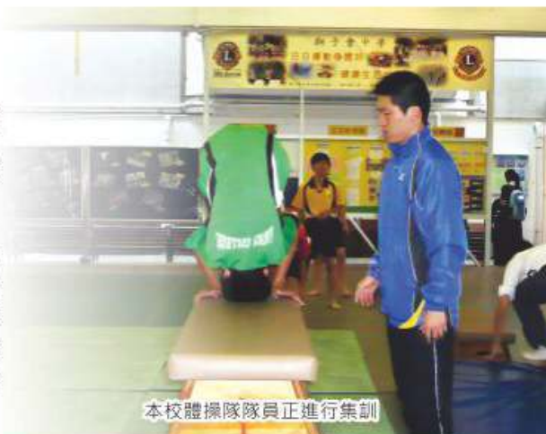
本校體操隊隊員正進行集訓

體操是一項較昂貴的體育項目，幸好得到校方的支持才能順利開展。體操隊的成立初期，訓練內容以基本技術為主，讓同學從遊戲中學習及建立自信。2009年，我校首次參加全港校際體操比賽並晉級8強，成績驕人。同年，本校在原有的基礎上發展競技啦啦隊等表演性高的隊際項目，讓同學從不同的比賽及表演中培養健康的核心價值。本年，我校啦啦隊參加全港18區啦啦隊大賽晉身決賽，成績被受肯定，更被葵青區區議會邀請代表葵青區參加第3屆全港運動會啦啦隊大賽。