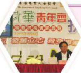
邀請不同界別的專業人士為同學進行演講

本組將繼續推行各項升學及擇業輔導活動，致力擴闊同學視野，協同學盡早認識升學及擇業的途徑，增強自信心，以積極的態度計劃自己的升學前途，為將來的事業作好準備。