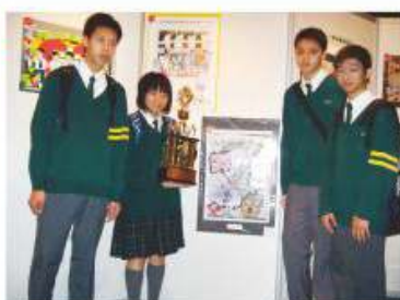
本校少年警訊於「恒生銀行協助警方撲滅青少年罪行比賽2010」獲得全港中學組季軍

同學參與各項少年警訊舉辦之活動，除可拋開緊張的讀書心情，盡情輕鬆一番外，亦加深了其對環境保護及警隊工作之認識，同學的滅罪意識亦因此而提高了不少。