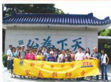
參觀孫中山先生故居 2005