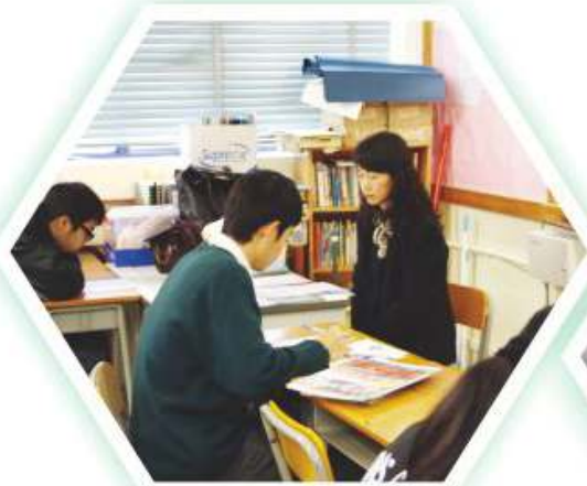
同學學習日語的情況

面對日趨多元化的商業環境，多學一門外語確是提升自己競爭力的最好方法。根據統計，全球現時共有約 7 億人學會日語、法語、韓語或西班牙語；法語更是全球 35 個國家之官方語言，足見這幾種語言於世界上是何等重要的。因此，學會多一種外語，對工作可謂無往而不利。此外，當同學修畢整個課程後，本校將安排同學應考相關之水平測試，包括日本語能力試驗及普通話水平測試等，測試除了讓同學清楚了解自己學習有關語言之進度外，更可豐富自己之履歷，於尋找工作或繼續升學均佔優勢。