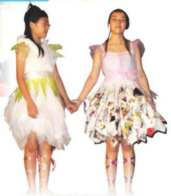
班際環保時裝設計比賽

環保學會活動大致可分為兩方面：一方面是全校性的，另一方面是只限會員參加。每年本會舉辦之活動包括：環保講座、參觀活動、班際環保時裝設計比賽、廢紙回收等等。本會亦會因應不同關注問題而舉行相應之活動，從而達到宣揚環保訊息的目的。