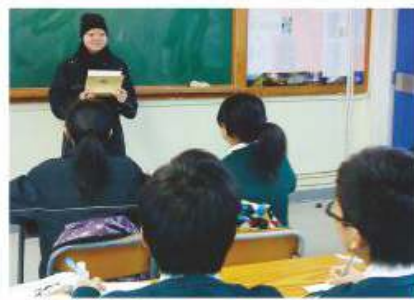
同學正進行個人短講

提升同學的語文能力及體會中國文化是中國語文教學的重點，藉著多觀摩，多參與，提升同學學習的自信心及興趣。本科積極鼓勵同學參加校外比賽，如朗誦比賽、寫作比賽、演講比賽、閱書報告等。同學皆積極參與各項比賽，更屢獲殊榮。此外，本科亦因應同學需要，舉辦適切之講座及工作坊，讓同學參與。本科更定期把同學優秀作品及學習成果向報社投稿。