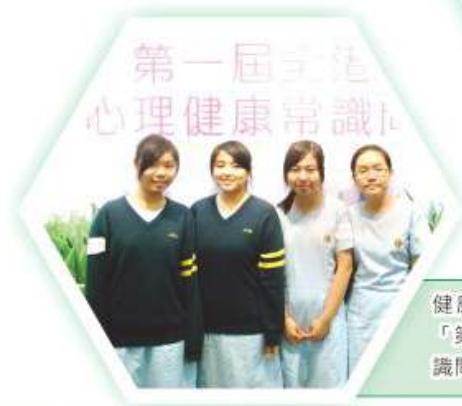
健康管理與社會關懷科同學於「第一屆全港中學生心理健康常識問答比賽」取得佳績

同學於本領域之教師指導下，均能根據其學習目標，運用適當之學習策略，並善用各種資源加強學習效果。同學亦能透過不同之學習方式，例如廣泛閱讀、瀏覽網頁、小組學習、專題研習等促進其學習，並能與同學互相交流及分享。這樣，不但能持續地藉著各類回饋肯定自己的優點，辨識弱項，作出改善，而且在改善學習的過程中，能建立自信和培養積極之學習態度。