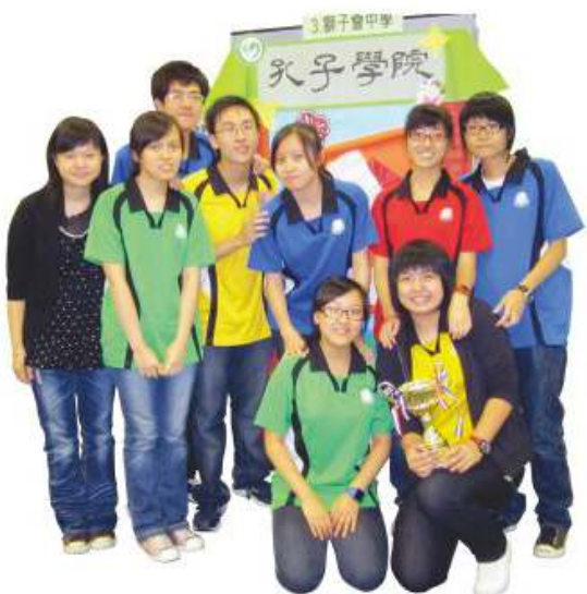
同學於國慶60周年展板比賽中獲得第三名

總括而言，本科於未來會繼續透過課程與不同學習活動，訓練同學掌握研究歷史之方法，從而建立歷史概念和個人的歷史意識。