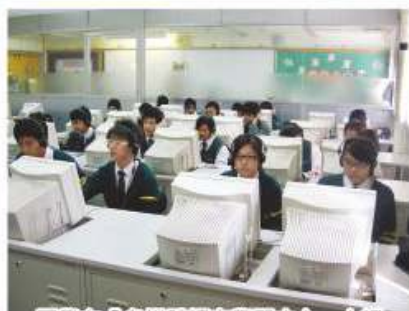
同學在「多媒體語言學習中心」上課