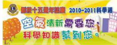
一年一度舉行之科學週

每年本學習領域均會舉辦不同形式之活動，以增加同學對學習科學之興趣。校內活動包括科學週、午間實驗室、心獅電台科學小錦囊節目、班際數理問答比賽及出版數理期刊等。此外，為了豐富同學不同的學習經歷，我們亦經常舉辦參觀活動、實地考察等，讓同學走出課室，放眼世界，感受科學的奧妙。同時，我們亦鼓勵同學參加校外科學比賽，除了提高同學對科學的探究精神外，自信心、與人溝通技巧及合作精神亦能透過比賽大大提高。