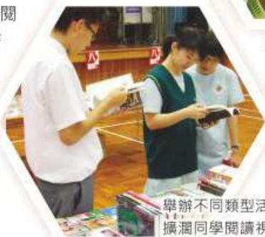
舉辦不同類型活動，擴闊同學閱讀視野