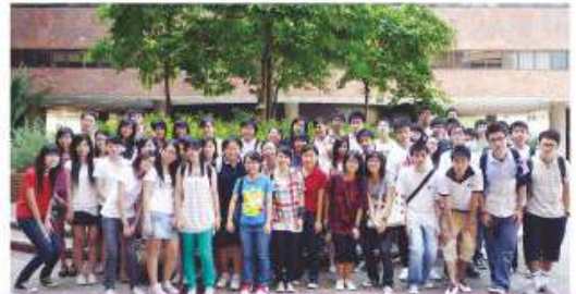
參觀香港理工大學

本組自1999年起成立，本組成員包括有3位統籌老師、9位協助老師及約12名分別由中四至中六級同學組成的學生輔導員。本組一直以來以協同學了解自己的興趣、能力和需要，以及協同學訂立升學或擇業為宗旨；透過安排不同的活動，讓同學們認識不同的升學或就業途徑，引發同學們關注切身的升學、選科及擇業各方面的問題。