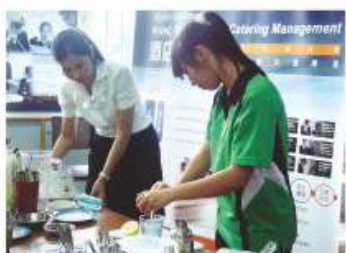
同學於酒店內實習調製飲品

同學學習這學科確實不容易，不過，他們是可以在這樣的一個活動教室下，能學得愉快，學得輕鬆。本科深信，這一切的經歷對同學日後從事如酒店、旅行社、旅遊景點或與服務行業等相關工作極有幫助。