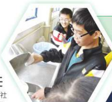
同學在實驗室聽完老師講解後，便到家政室進行薑汁撞奶實驗

本科每年均與生物科及物理科合作舉辦科學週，當中會進行有趣實驗、比賽及遊戲等，以提升同學對學習科學的興趣及經歷。本科每年亦積極鼓勵同學參加「香港化學奧林匹克」比賽，讓同學有更深刻之體驗。