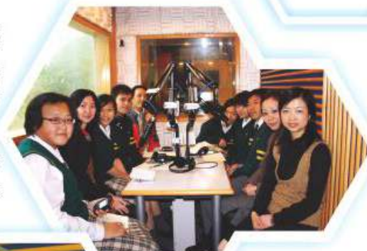
老師往往成為心獅電台中的訪問嘉賓

於10年間，所有曾協助過電台運作之同學，均獲益良多。同學於撰寫講稿及擔任主持之過程中，兩文三語水平得以提高；台長於統籌節目之過程中，溝通與協作能力得以培養。更重要的是，心獅電台之運作，基本上均由同學們全權負責及統籌的，老師給予同學極大之發揮空間，心獅電台確實是一個理想之學習小天地。