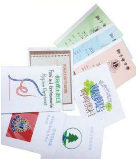
經濟與商貿科之自編教材