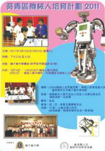
本學習領域為區內小學生舉行機械人培訓課程及比賽