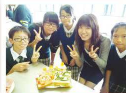
導師制三文治製作活動

「導師制」計劃之宗旨是為協助中一級同學盡快適應中學生活、掌握各種的生活技能，從而培養他們積極面對成長困惑之精神。計劃以小組形式進行，小組成員包括3至4名中一級同學、最少一名高年級之大哥或大姐姐及一名老師。透過導師制計劃，學校的和諧及關愛氣氛得以營造。輔導計劃方面，本組學生輔導員於午膳及放學時間均為同學解答功課上之問題。同時，亦為一些有不同需要的同