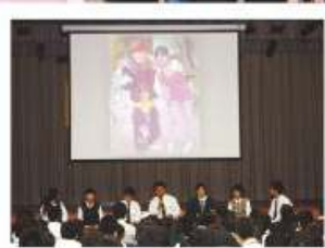
同學於週會分享其於交流活動之親身體驗