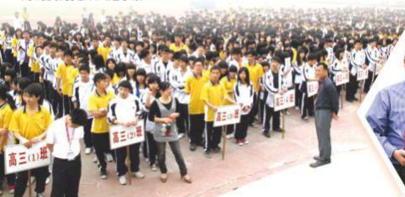
高要市第二中學全體師生列隊歡迎本校校長及師生之蒞臨

本校成功獲教育局德育及公民教育組「赤子情·中國心」資助計劃2010、獅子會中學法團校董會及獅子會中學家長教師會贊助，於2011年4月20至23日遠赴廣東肇慶市進行交流活動。本校師生於是次交流活動中，除遊覽了七星岩、八卦村、端硯文化中心、造紙村、豐田汽車廠等景點外，亦到過高要市第二中學進行交流。是次活動讓兩地師生能作學術交流，並讓本校師生對兩地教育制度有更深入之了解。