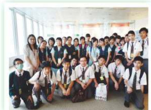
同學參觀香港金融管理局