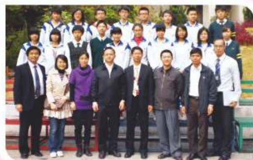
廣州華僑中學師生訪校，共同交流兩地教育的情況