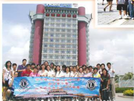
山東國情歷史文化考察團 2005