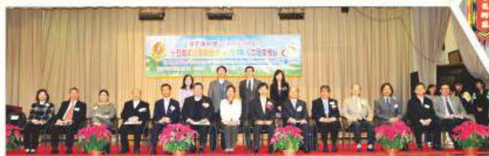
一眾嘉賓蒞臨本校主持15周年校慶開展禮