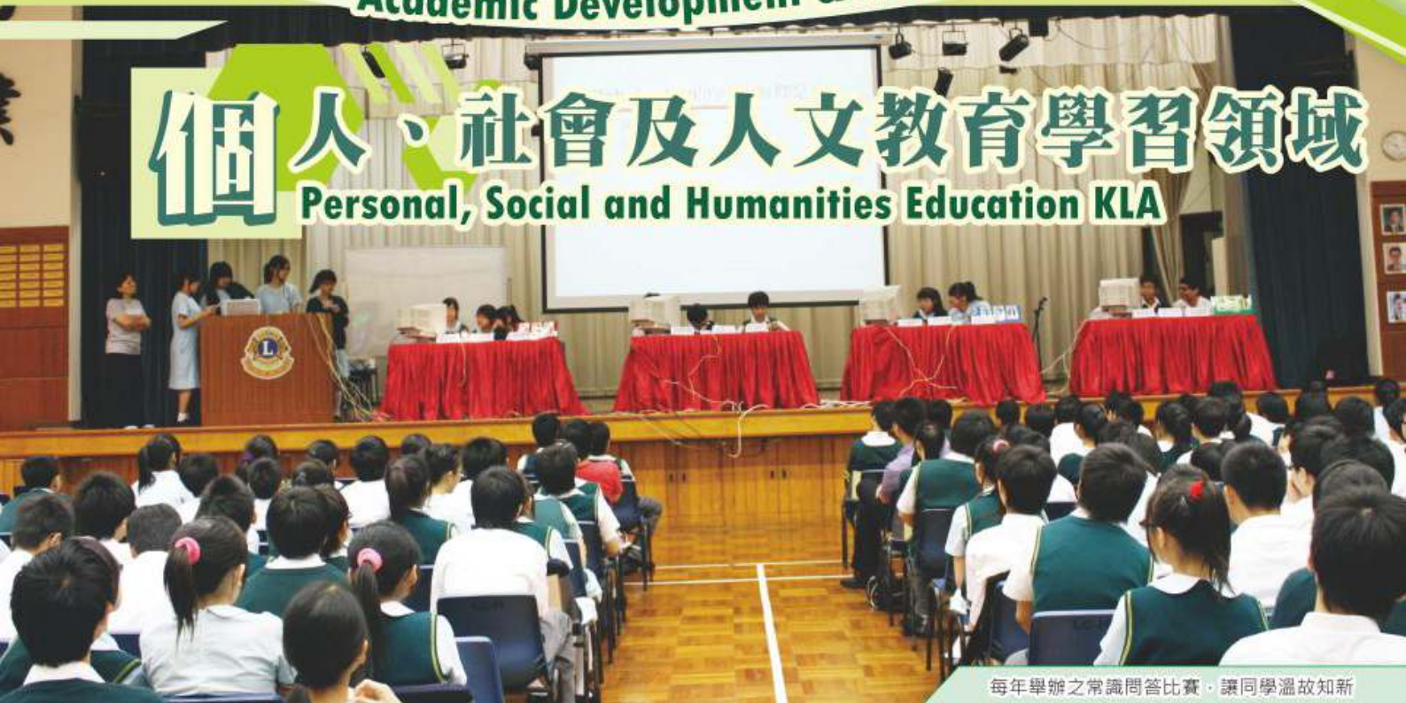
每年舉辦之常識問答比賽，讓同學溫故知新