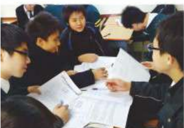
語文教育學習領域推行協作學習之情況

為提升同學的寫作能力，本科主張多寫多作。初中同學除了繳交基本作文課業外，還要按照學習重點或生活點滴，寫作札記，提供寫作機會。