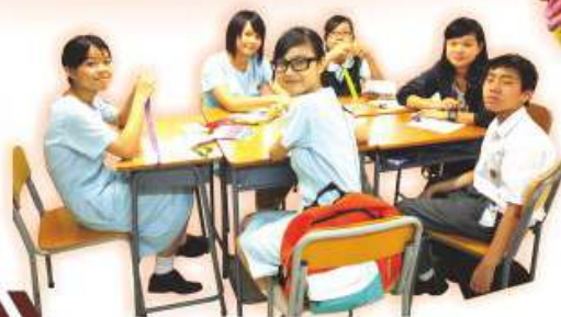
哥哥姐姐與中一級同學於導師制活動合作摺紙花。

中一級同學於學期初，親手摺紙花及撰寫心意咭送予小學老師，感謝他們多年來悉心的教導。