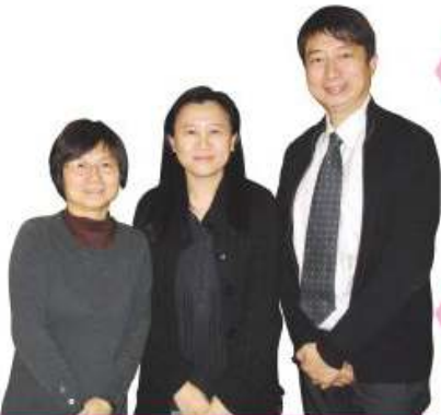
本校教育政策及研究組成員

本組成員經常因應校內政策的問題，向本校教師進行調查，並整理相關調查結果，讓教師能透過掌握相關數據及其分析，了解其教學成效。調查結果亦會用作檢視相關政策之依據，並為改善政策之討論提供客觀之數據分析結果。