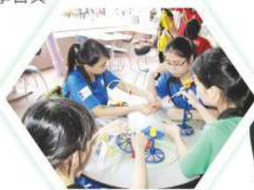
同學於迪士尼主題公園進行物理趣味實驗

為配合新高中課程發展，本科添置了不同之實驗儀器，務求能安排同學進行更多實驗及專題研習，讓同學增加實踐理論之機會，以加深對不同物理現象之認識。此外，本科亦於各級積極推行專題研習，並邀請同學參加不同之校外物理比賽，藉以培養同學以科學方法解決問題之精神、批判性思考能力及溝通協作能力。