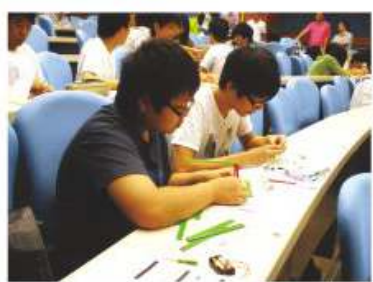
參與大專院校機械人工作坊