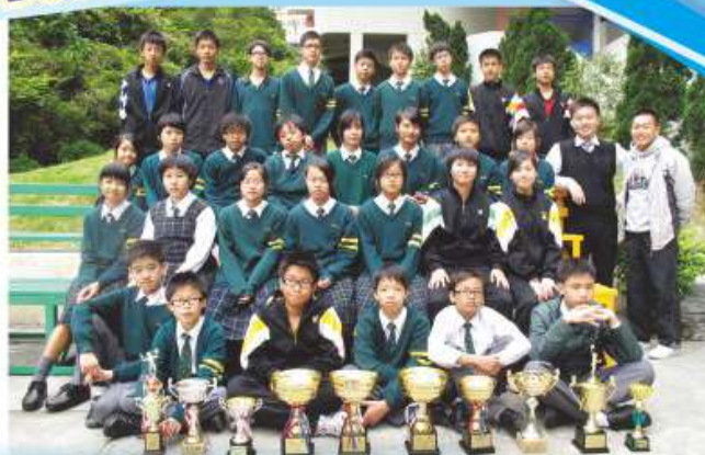
本校手球隊之成績有目共睹

手球隊成立至今，成績驕人，每屆的學界賽事都能奪得獎牌。及後更發展沙灘手球及巧固球。同學們亦能在不同的比賽中學習，吸取經驗，創造佳績。