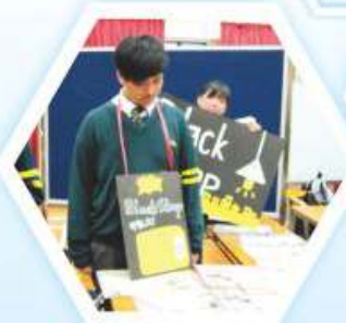
同學為落實營商計劃 各出奇謀

為配合企業、會計及財務概論科課程，本學會舉辦校內營銷活動，以加強同學對商科之興趣，讓同學把學科知識應用於活動上。商科學會會員協助籌辦營商活動予中五級修讀企業、會計及財務概論科課程之同學，同學們透過了解籌辦營商活動整體過程，深思現今商業社會的情況。