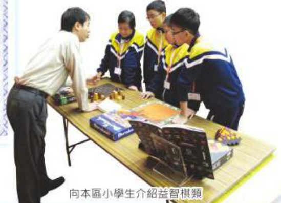
向本區小學生介紹益智棋類