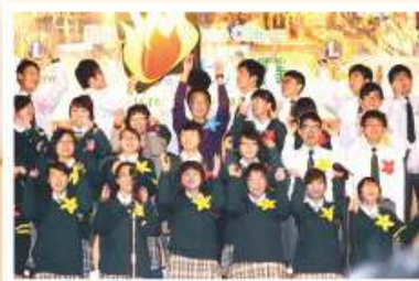
同學於才藝比賽中載歌載舞