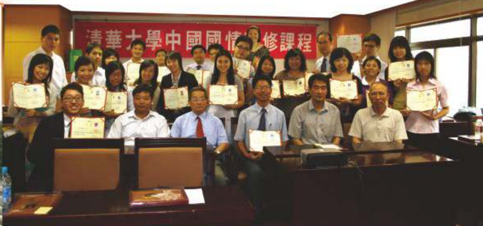
清華大學國情研修課程 2008