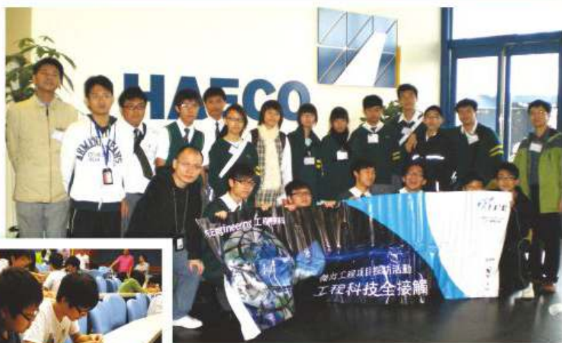
參觀「香港飛機工程有限公司」

本科安排同學進行參觀活動及參與比賽，希望同學能夠擴闊視野及發掘潛能，例如於2010年同學曾經參觀「香港飛機工程有限公司」及「九龍灣港鐵訓練學校」。同學亦有不少機會參與大專院校舉辦的工作坊及各類比賽，例如同學曾經在「全港校際太陽能模型車大賽」及「節能燈設計比賽」分別獲最佳設計獎及優異獎。