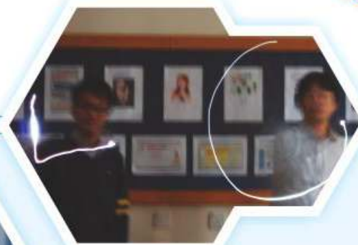
同學於「在空氣中寫字」活動中之攝影作品