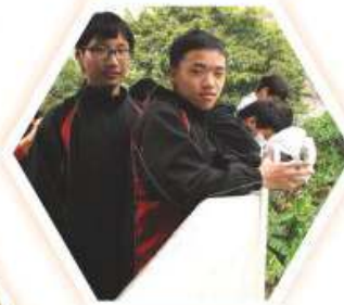
同學測試自製的「雞蛋保護裝置」