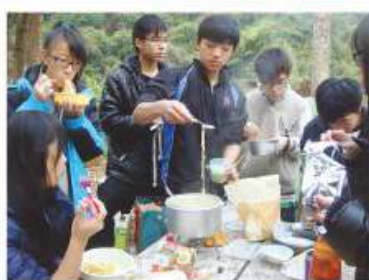
接受野外鍛鍊後，同學要補充體力