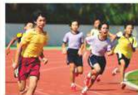
區內小學生的賽跑速度，絕不遜色於本校之同學