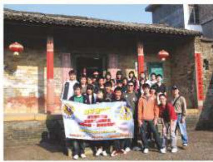
通識教育科舉辦之情繫中國－農村教育考察之旅 2008