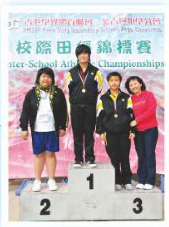
本校田徑隊之成績有目共睹