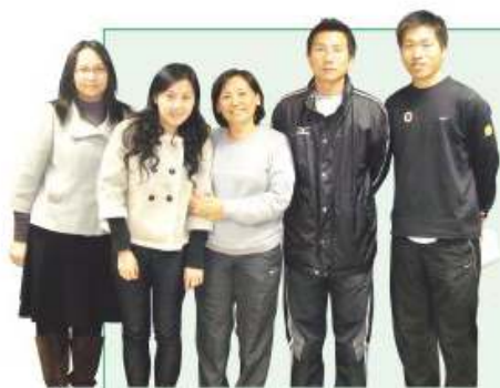
體藝教育學習領域之成員