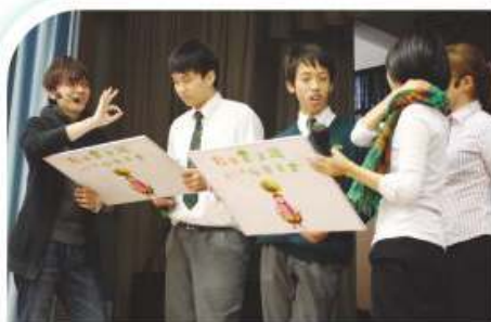
同學正投入觀賞名為《幸福將來》之話劇

經濟學是一門研究人類行為及如何將有限資源進行合理配置的社會科學。為了讓同學學會從經濟學角度探究人類行為及社會議題，培養經濟分析的能力，本科於課堂經常與同學討論時事議題，並定期進行報章分享。此外，透過舉辦講座及參觀活動，增加同學對經濟學的認識及提升對本科的學習興趣。本學年本科與企業概論科進行跨科合作，參與「學生營商體驗計劃」，為同學提供為期8個月的學習之旅，透過創立及營運自己的公司，把書本學到的經濟知識應用於日常生活之中。