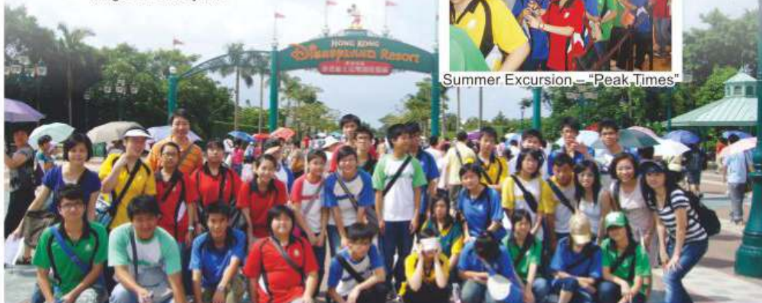
Summer Excursion – "Peak Times"