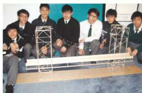
同學參加全港中學生砌橋比賽2010

中三級教學內容主要是有關熱學之課題，同時加入專題研習、閱讀科學篇章、參與校外物理比賽及課堂實驗，務求提高同學對本科之學習興趣，並擴闊視野，創意思維亦得到啟發。