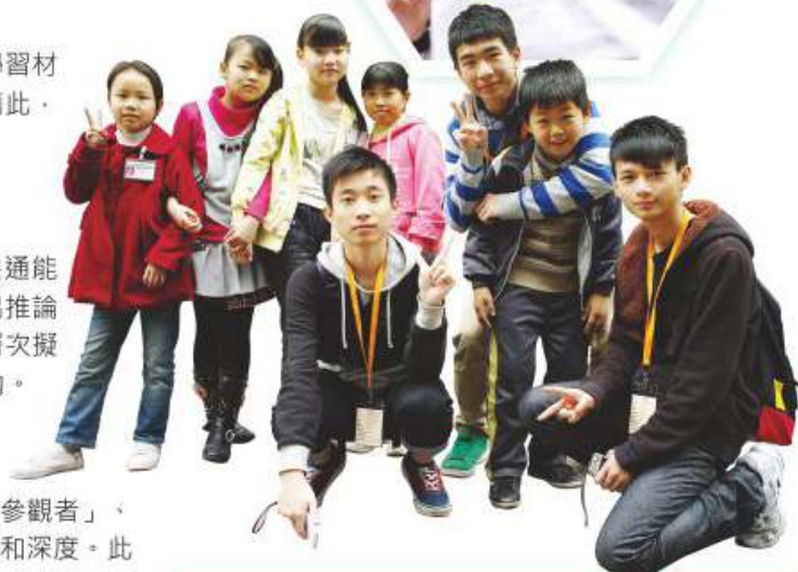
同學在香港青年協會之安排下於廣東省東莞市為當地之民工子弟提供義工服務