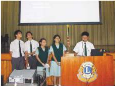
Sharing session on overseas exchange

Providing students with an optimal environment conducive to acquiring English is our ongoing mission. Immerse oneself in an English-rich environment is internationally recognized as one of the best ways to learn English. Utilizing the immersion approach in conjunction with regular lessons, formal and informal extra-curricular activities are organized within the school so as to maximize opportunities for pleasurable and meaningful language learning and enhance cultural awareness and creativity. A range of activities that promote genuine communication and develop students' communicative competence are organized to ensure we cater to all learners needs and stimulate their interest.