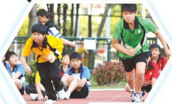
四社健兒於田徑場上一較高下