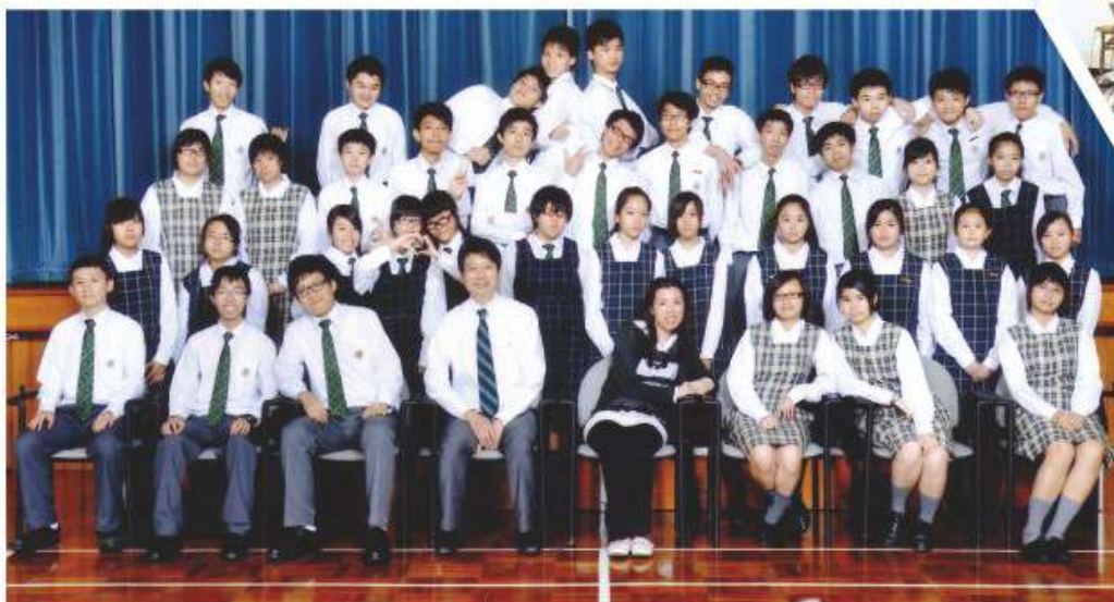
2010至2011年度圖書館服務組組員合照