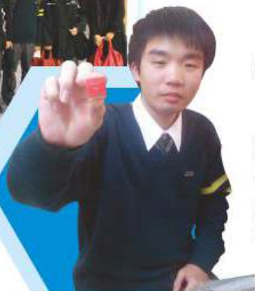
同學自製圖章，了解中國四大發明之一——印刷術

中國文化博大精深，源遠流長，中國人從易經之宇宙觀衍生了人倫、醫藥、武術、命理等各種各樣學問。國粹學會之前身為書法學會，我們發現近年有興趣學習書法之年青人甚少，而且他們缺乏耐性，故本會於書法之基礎上注入其他元素，例如：篆刻、對聯、謎語、剪紙、面譜、預言、武術、氣功等內容，務本豐富同學對中國文化的認識。