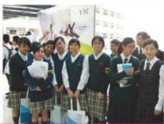
參觀香港專業教育學院

本組自1999年起成立，本組成員包括有3位統籌老師、9位協助老師及約12名分別由中四至中六級同學組成的學生輔導員。本組一直以來以協同學了解自己的興趣、能力和需要，以及協同學訂立升學或擇業為宗旨；透過安排不同的活動，讓同學們認識不同的升學或就業途徑，引發同學們關注切身的升學、選科及擇業各方面的問題。