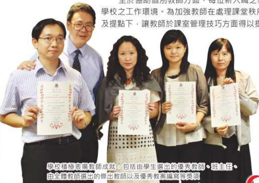
學校積極表揚教師成就，包括由學生選出的優秀教師、班主任，由全體教師選出的傑出教師以及優秀教案編寫等獎項

至於協助個別教師方面，每位新入職之教師均會獲安排一位資深同事作為伙伴，以協助其盡快適應學校之工作環境。為加強教師在處理課堂秩序方面之技巧，本組安排機會讓教師結為師友，於互相觀摩及提點下，讓教師於課室管理技巧方面得以提升。