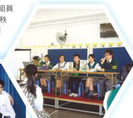
組員於午間欣賞會向同學介紹圖書

圖書館服務組之宗旨是希望透過訓練與實習，讓組員掌握圖書館管理的知識與技巧。組員在圖書館當值時均會負責不同之工作，包括圖書借還、圖書保養、書架整理及維持圖書館秩序等。除了日常工作之外，圖書館服務組幹事亦擔任閱讀大使，他們負責組織閱讀會，定期舉行閱讀會聚會，向同學介紹不同主題的書籍，分享閱讀的樂趣，營造校園之閱讀氣氛。