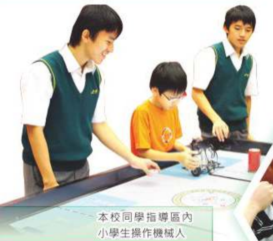
本校同學指導區內小學生操作機械人