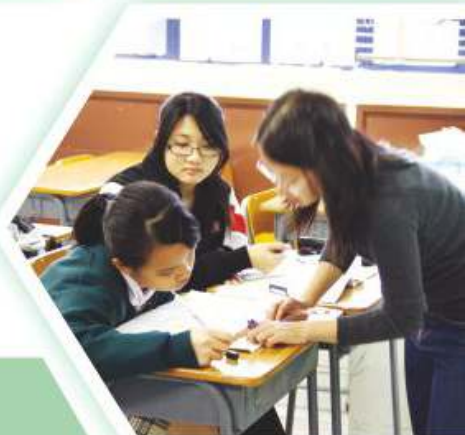
老師個別指導同學