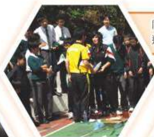
同學用心設計水火箭，進行激烈比賽