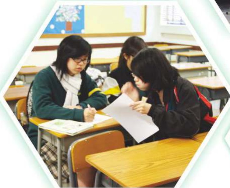
同學們都很用心學習