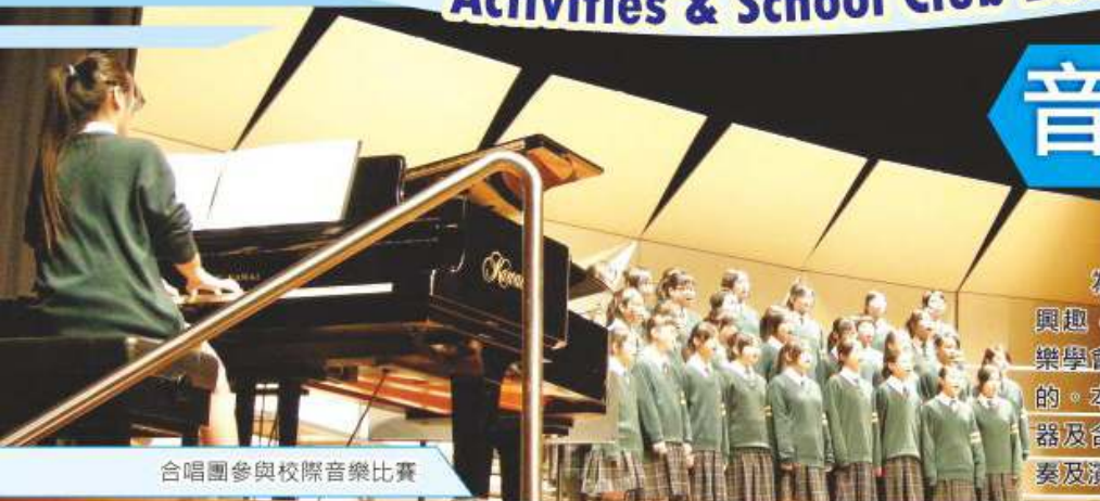
合唱團參與校際音樂比賽