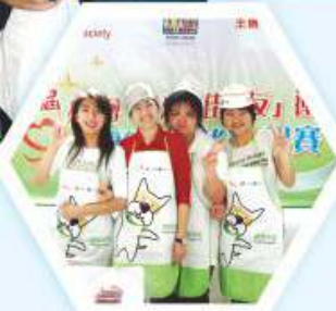
同學穿上圍裙參加烹飪比賽