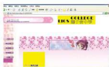
中三級同學利用 Dreamweaver 編寫個人網頁