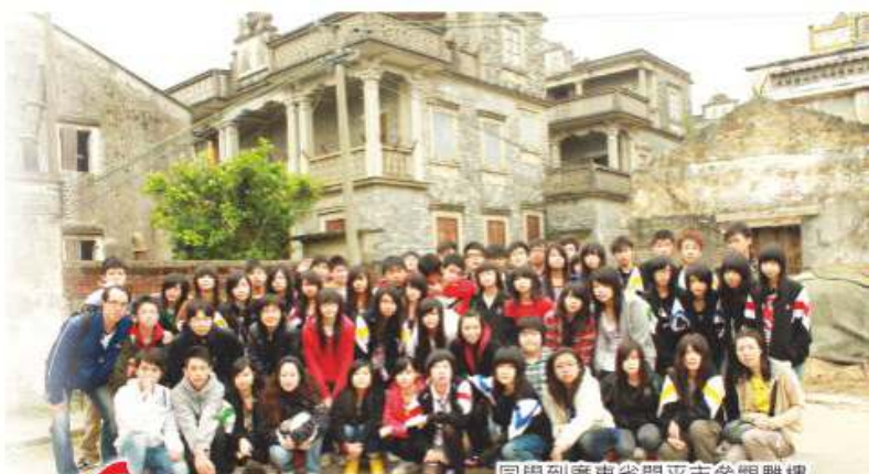
同學到廣東省開平市參觀雕樓