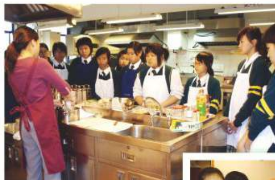
同學在聆聽教師於實習課的講解

本科以培養同學健康飲食習慣為首要目標，同學透過課程，認識食物的營養價值和食物與健康之間的重要關係。本科為配合衛生署舉辦之「生果日」，以蔬果為題，向同學宣揚培養每天吃蔬果之習慣。本學年，本校更成功申請衛生署全港中學「果然玩「創」教室 - 校園水果推廣計劃之促進校園健康飲食基金，舉辦了一連串之校園活動。透過舉辦不同之活動，以提高全體師生吃水果之數量，並改變同學們少吃水果之不良飲食習慣。