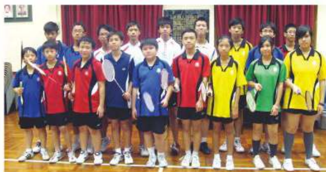
本校羽毛球隊之精英