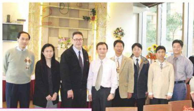
本校行政電腦系統小組成員

本組近年工作重點包括：確保行政電腦系統於新高中學制下能順暢運作；調適現有電腦程式及行政程序，以便流暢地使用WebSAMS 2.0新系統；維持製作學生表現評核報告之工作效率及其可靠性；為所有教職員提供使用行政電腦系統之培訓及相關支援，並確保軟件及硬件於良好運作狀態。