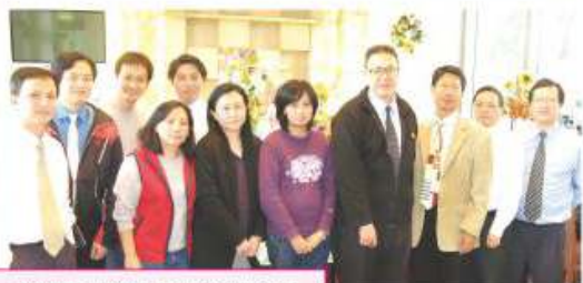
本校學校健康及安全組成員

本組宗旨是促進各師生、工友之合作，致力確保學校成為一個安全的學與教環境，並提升師生對知識產權的認知。本組每年均透過舉辦不同活動以提升教職員和同學於健康及安全方面之意識。本組的主要工作包括：安排同學購買個人意外保險計劃、注射預防流感疫苗；收集及向教職員提供同學長期病患資料；協調學校護士義工計劃；進行防疫注射統計及分析；舉行中一級急救講座、知識產權講座、暗瘡預防及皮膚護理講座；籌劃安全校舍選舉等。