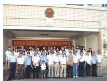
同學參與福建、廈門滅罪及文化交流團 2010