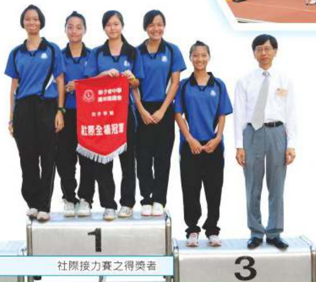
社際接力賽之得獎者