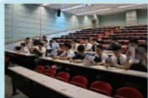
在大學演講室等候講者