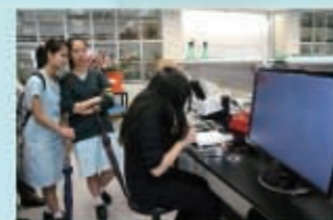
從電子顯微鏡觀看花的內部結構