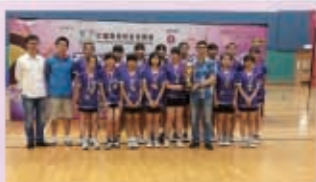
2016全港校際閃避球錦標賽，女子組冠軍