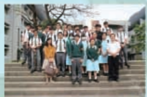
在百萬大道留下美好回憶