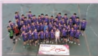
5月24日香港電台訪問本校閃避球隊