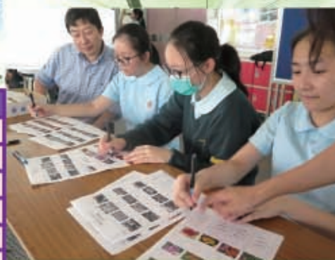
學生積極參與園藝學會的午間欣賞會