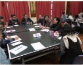
學校自評分組討論一隅