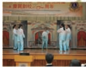
四明中學代表表演六式太極拳