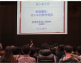
范珮珩教育心理學家分享青少年精神健康