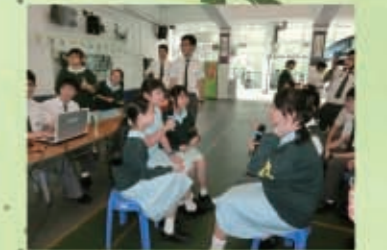
同學都投入比賽，七情上面