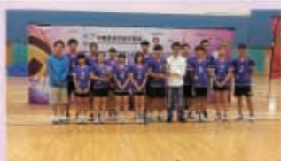
2016全港校際閃避球錦標賽，中學混合組季軍