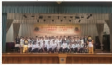
四明中學訪問團與獅子會中學師生大合照