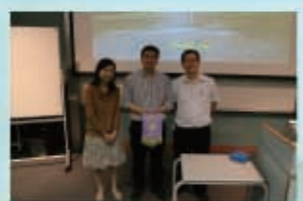
頒發紀念旗予講者