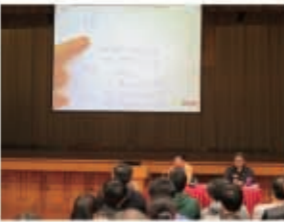
余英豪老師代表小組匯報自評結果