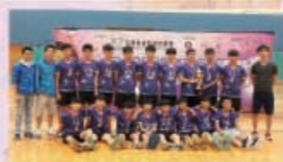
2016全港校際閃避球錦標賽，男子組冠軍