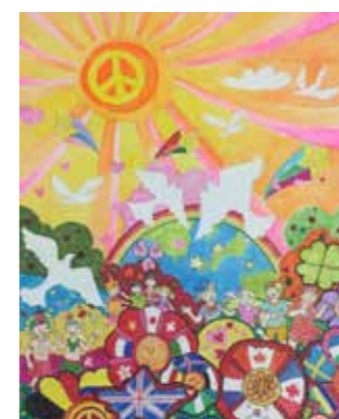
中一同學用心創作，表現積極。