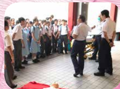
救護員介紹救護站內設施