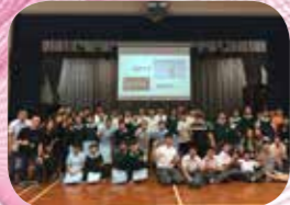
第一次學校起動計劃「服務學習」面見聚會