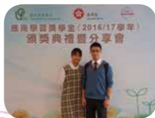
林同學與譚老師合照