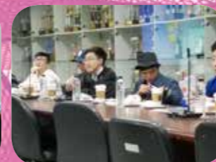
兩位舊生分享在醒吾科技大學的讀書情況