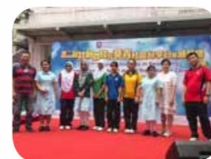
本年度小組參加了「撻著共融」創意服務競賽，並獲得了優異獎。

文化推廣展覽讓不同種族的學生一起學習多國文化，鼓勵共融文化生活，使共融種子落於學生身上成長發芽，從而推廣共融學校，加強凝聚和包容精神。同學可以認識不同文化及從日常生活學習中文。