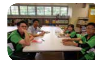
師生分享閱讀心得。