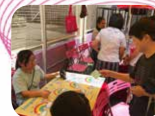
同學通過攤位活動，穿上少數族裔的服飾拍照，認識不同文化