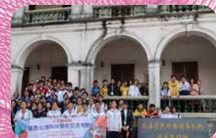
一起參觀外國領事館