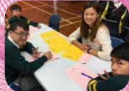
兒童發展基金解難七部曲