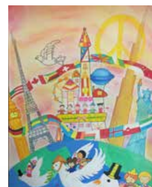
中一同學的優良作品