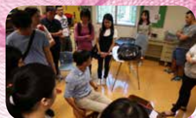
學校職員示範特殊器具的使用