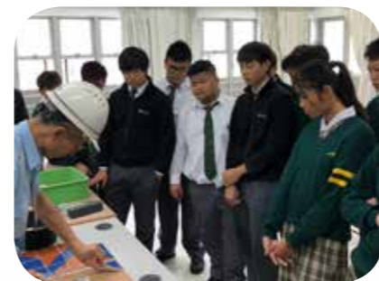
同學專心觀看導師示範鋪砌瓦仔步驟

本組透過「創建生涯路」計劃，安排 17 位中五同學於 2017 年 12 月 14 日參觀建造業議會訓練學院葵涌訓練中心，讓同學認識本港建造業前景及由建造業議會訓練學院所提供的建造業人才培訓課程。學院導師除了介紹課程內容和特色外，還讓學生體驗鋪砌瓦仔圖案及使用工程測量儀器，令學生明白到建造業是一門專業行業，十分注重工藝培訓及技術提升。