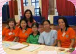
第一次友師簡介會