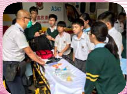
同學認識各種急救藥物