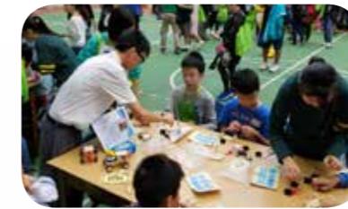
「葵青區中學巡禮 2017」 小六學生參與本校的 STEM 工作坊

本年度一如以往，本校參與了由荃灣區議會社會服務及社區宣傳委員會社區綜合服務工作小組與荃灣區家長教師會聯會有限公司合辦的「升中博覽 2017」活動，以及由葵青區家長教師會聯會有限公司舉辦的「葵青區中學巡禮 2017」及「2017 葵青區中學資訊日」。「2017 葵青區中學資訊日」為首次舉辦的活動，在得到葵青區議會贊助下，於葵芳社區會堂舉行。以上各項活動的目的均是為了讓小六學生及其家長，了解不同學校的辦學理念、設施及課程等，以備升中選校時，作為參考之用。學校每年亦藉此讓本校同學能有參與服務的機會，從中學習與人溝通的技巧。