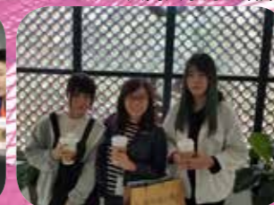
兩位舊生很開心有老師探訪，彼此流露出不捨之情