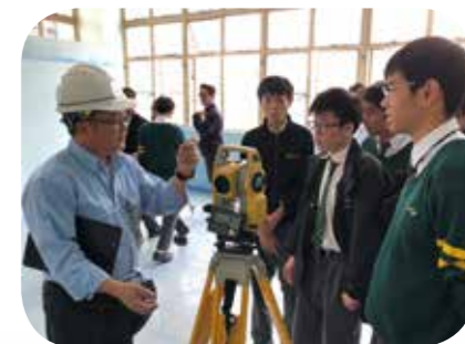
同學詢問導師測量儀器的運作及原理