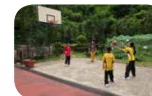
導師和組員一同 進行球類活動。