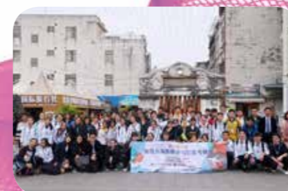
一起參觀北海老街