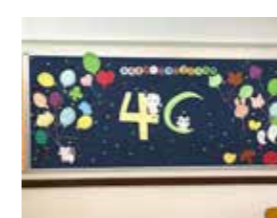
4C - 冠軍