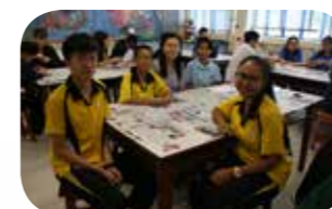
一邊做手工，一邊談天。