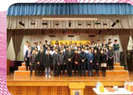
廣西北海市實驗學校獅生到訪本校的大合照

同月的20及21日，北海市實驗學校28位師生回訪本校，20日當日，試當一天獅子會中學的學生，與學習對子一起上課。21日上午參與了才藝比賽及聖誕聯歡。共同締結良好的姐妹情誼。