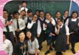
學校起動計劃「服務學習」午間活動 (香港理工大學)