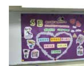
5E - 亞軍