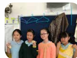
頒獎禮當日，同學熱心服務，炎熱天氣下負責攤位遊戲