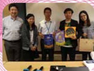
由郭副校致送紀念旗及紀念品予大學代表