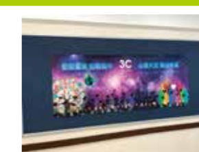
3C - 亞軍