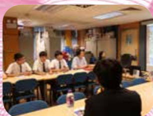
台灣大同大學代表介紹大學學習環境、課程內容及收生要求