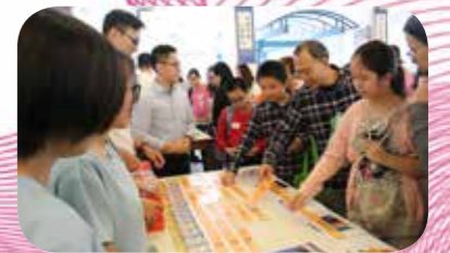
小六學生及家長一同 參與學習領域攤位遊戲

由本校籌辦的「升中資訊日」已於 2017 年 11 月 18 日 (星期六) 舉行，是次活動的目的是讓本區小六學生及家長參與本校的升中講座、工作坊及各學科學習活動，多了解中學的學習生活。當天亦同時邀請了中一級的同學一同參與，讓他們能進一步體驗校園生活，以及對各科學習內容有更多認知。當天的活動包括： 講座：內容包括中學生活多面睇、升中學習轉變及面試技巧 親子工作坊：讓家長與子女一同參與有關 STEM 的活動 學習領域攤位遊戲：從活動中學習相關的學科知識