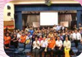
兒童發展基金友師義工培訓