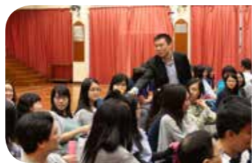
羅健明校董與老師們互動分享