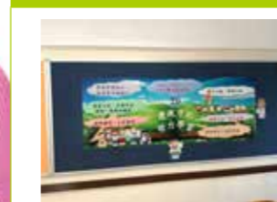
2D - 冠軍 及 最展現班別特色獎