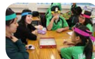
一同玩樂， 建立良好師生關係。

導師制活動的目的是協助中一同學盡快適應新環境，享受愉快的校園生活。所有中一新生都會配對一位老師和 2-3 學長組成導師制小組，透過學長及老師的關愛，陪伴中一同學健康成長，除了可建立校園關愛文化，更可培養高年級學生「我們服務」的精神，增加學生對學校的歸屬感。今年 10 月生活教育組首次舉辦「導師制休閒日」，讓中一新生與中五同學、老師一起參與非教學活動，如下棋、做手工、看圖書、進行球類活動等，大家在輕鬆、愉快的環境下建立良好師生關係。