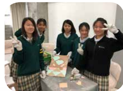
同學體驗鋪砌瓦仔工藝