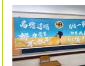
4B - 最展現班別特色獎