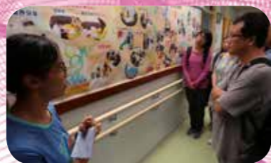
學校職員講解照顧特殊學生的流程