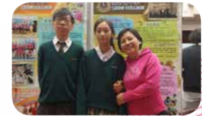
2017 葵青區中學資訊日