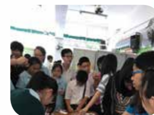
同學積極參與攤位活動，品嚐南亞小食和製作印度手繪鎖匙扣