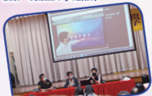
介紹 e-class 通訊 App 的運作

9月30日為本年度第一次教師專業發展日，當日活動內容非常豐富。在上午時段，我們先安排學生事務委員會代表向全體老師講解今年對學生行為的關注，並詳述推行「約法三章」的各項細節，之後，資訊科技教育發展組代表向同事介紹 e-class 通訊 App 的運作及各個功能。