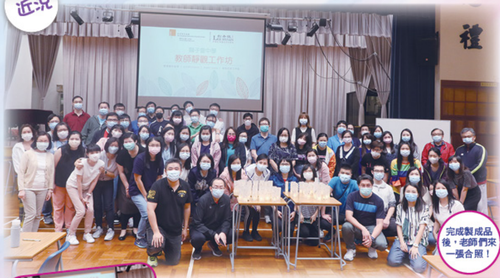
完成製成品後，老師們來一張合照！