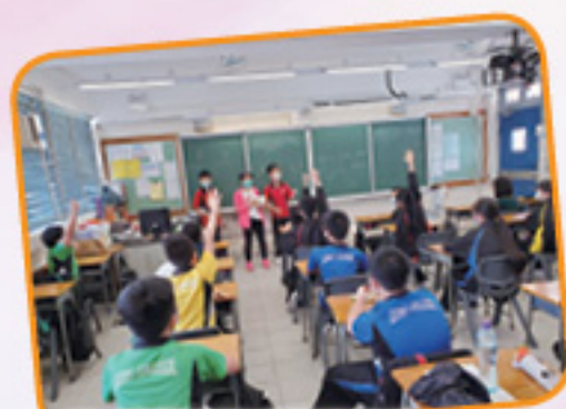
1D 同學積極參與班活動