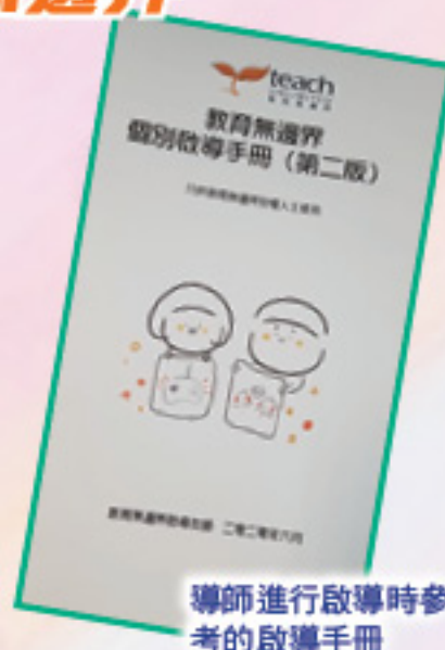
導師進行啟導時參考的啟導手冊