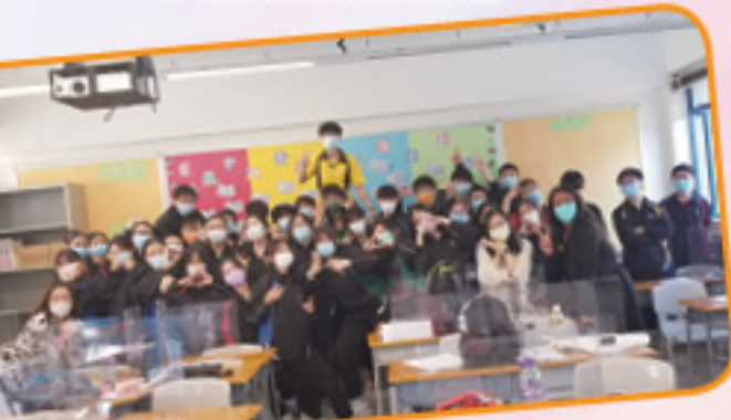
4CE 全班開心完成所有活動了