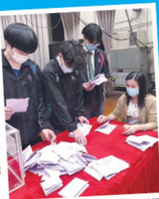
家長義工正監察學生會學生點票情況

學生會選舉是全校學生都會參與的盛事。在激烈的選情下，同學對點票的工作十分重視，因此特別邀請了家長教師會的家長義工協助監票，以示選舉的公平、公開、公正。