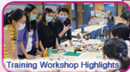
Training Workshop Highlights