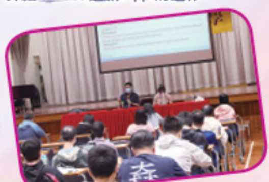
香港教育城代表詳解「網上試題學習平台」的運作