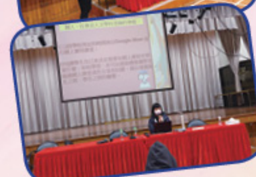
各學習領域代表分享網上學與教策略

在下午時段，老師們有機會嘗試一次靜觀體驗，讓老師們暫時放下思考分析和正在處理的事務，去察覺當刻自己的身心狀況。整日活動在一個輕鬆愉快的靜觀體驗中圓滿結束。