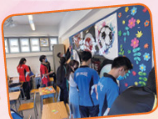
5B 同心合力完成壁報