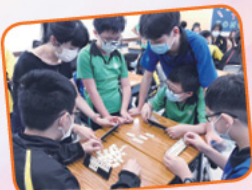
2A 班主任與同學齊齊玩