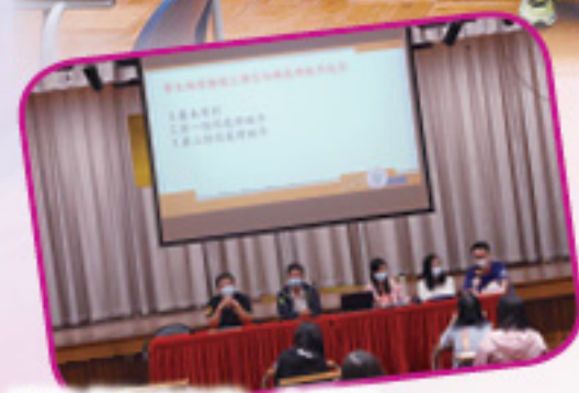
講解「約法三章」之推行

9月30日為本年度第一次教師專業發展日，當日活動內容非常豐富。在上午時段，我們先安排學生事務委員會代表向全體老師講解今年對學生行為的關注，並詳述推行「約法三章」的各項細節，之後，資訊科技教育發展組代表向同事介紹 e-class 通訊 App 的運作及各個功能。