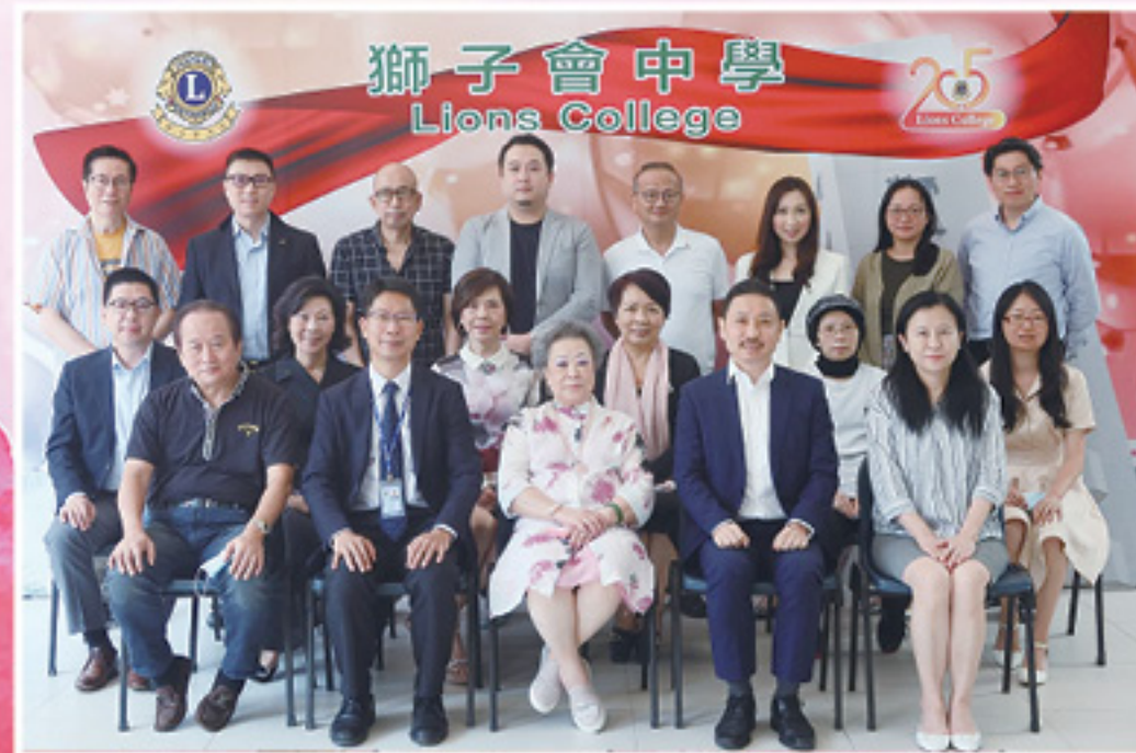
獅子會中學法團校董會全體合照