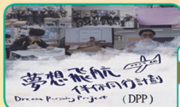
Online Sharing on 2020/2021 Staff Development Day