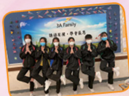
3A 多謝各位我們完成壁報了