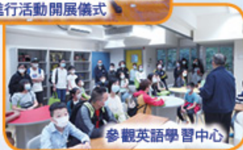
參觀英語學習中心