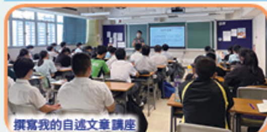
撰寫我的自述文章講座

本校升學及擇業輔導組為了讓同學掌握各類課程申請的方法，按類別為同學們準備了「JUPAS選科」、「E-APP選科」、「VTC選科」、「台灣升學」及「內地升學」五個類別的講座和工作坊，還製作教學影片指導同學進行網上申請，讓同學們專心學業之餘，仍能順利完成升學選科。