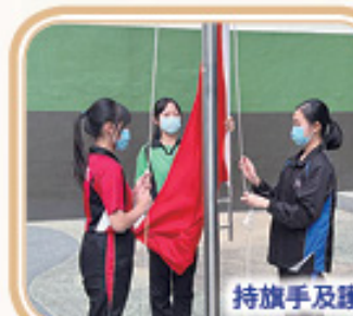
持旗手及護旗手各司其職!