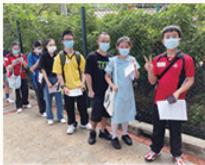
本組於2021年8月帶領家長和學生到林士德體育館，注射新冠疫苗。

為提升本校學生的接種比率，本組早前已舉辦六次學生集體注射活動。待第一學期考試後，本組將再舉辦有關活動。屆時請踴躍參與。