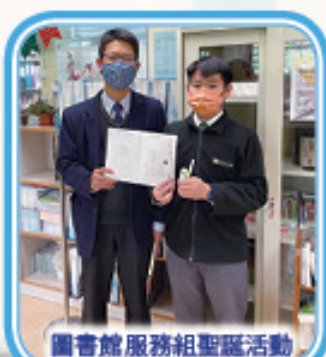
圖書館服務組聖誕活動