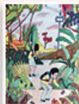
6E 曾紫珊 傑出作品獎