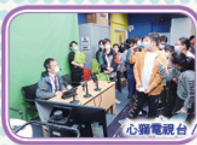
心獅電視台 / 壯志飛翔訓練中心