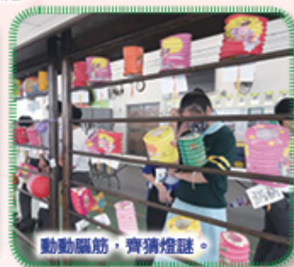
動動腦筋，齊猜燈謎。