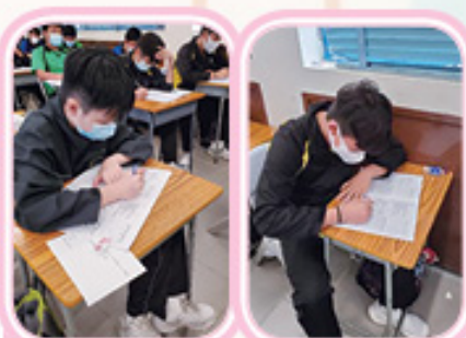
同學積極參與個人成長探索活動