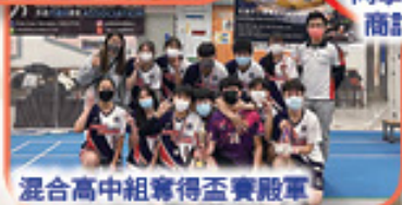
混合高中組奪得盃賽殿軍