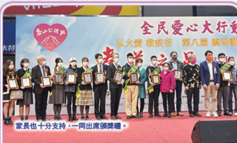
家長也十分支持，一同出席頒獎禮。