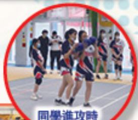
同學進攻時 高討戰術