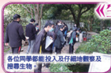
各位同學都能投入及仔細地觀察及搜尋生物。

同學需於半天課程時間內進行活標本搜集、資料搜查、數據分析及分組匯報。當天同學表現投入，能夠分工合作，並做出精彩的匯報。事後學生亦反映活動有趣，獲益良多，若果可以安排更長的戶外時間，會更精彩。