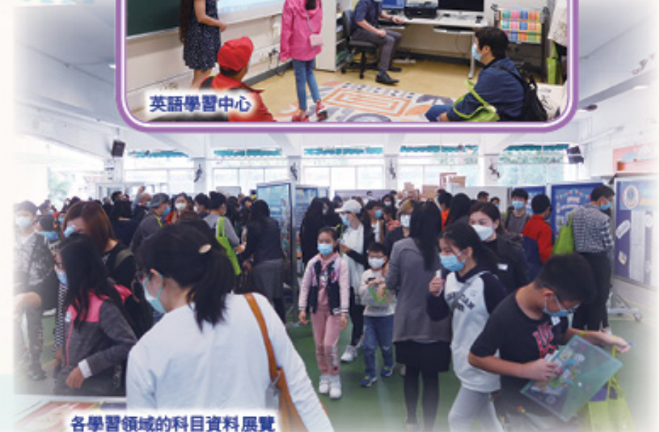
各學習領域的科目資料展覽