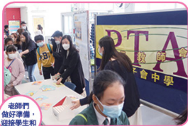
老師們 做好準備， 迎接學生和 家長