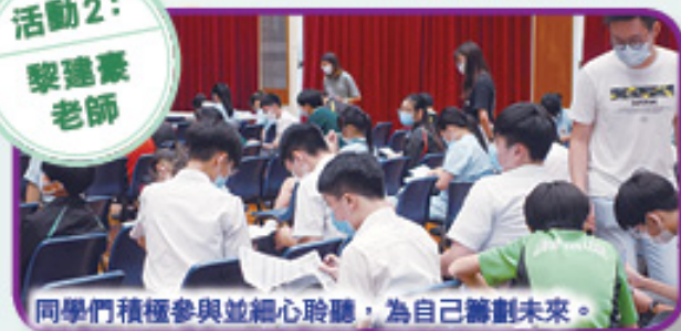
同學們積極參與並細心聆聽，為自己籌劃未來。

為讓中三級同學了解個人興趣、能力、價值觀等，並為選科作準備，學校為同學舉辦高中課程簡介講座及工作坊，內容包括新高中必修與選修科目、選科注意事項、應用學習課程及大學一般入學要求等。