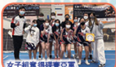
女子組奪得碟賽亞軍