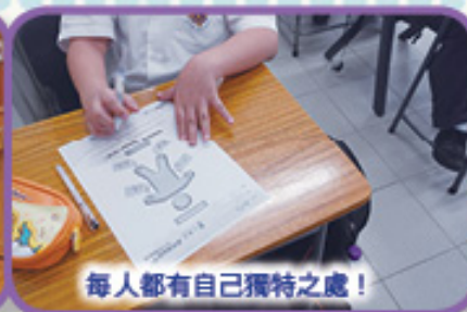
每人都有自己獨特之處!