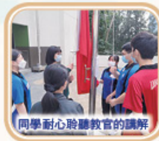
同學耐心聆聽教官的講解

此外，十名高中學生亦於12月8日及15日出席了兩次升旗培訓，該培訓由解放軍擔任教官，學生認真學習，表現非常理想。