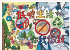
5E 劉佩怡 傑出作品獎