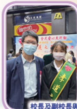
校長及副校長與得獎同學合照!