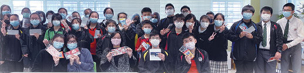
學術及閱讀獎勵計劃