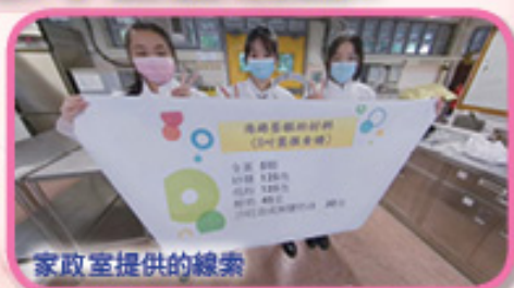
家政室提供的線索

本年度共有18所小學、約530名小學生於12月6日至12月10日登入學校網頁，透過本校平面圖進入指定班房和特別室，於360度全景相片中尋找線索，解答一系列題目，超過95%小學學生認為活動十分有趣。