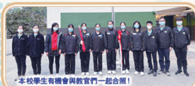
本校學生有機會與教官們一起合照!