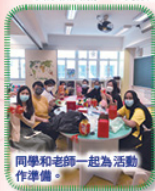
同學和老師一起為活動作準備。