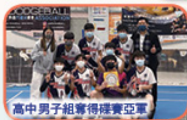
高中男子組奪得碟賽亞軍

感謝香港閃避球總會讓我們有機會參與這次既刺激又具挑戰性的比賽,希望同學鍛鍊好技術和體能,下年繼續爭取更佳的成绩。