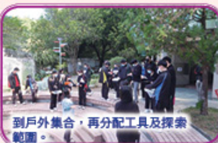
到戶外集合，再分配工具及探索範圍。