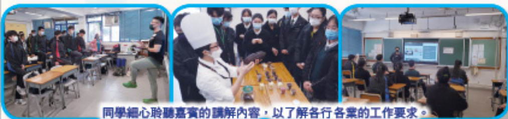
同學細心聆聽嘉賓的講解內容，以了解各行各業的工作要求。