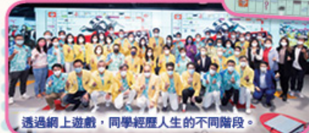
透過網上遊戲，同學經歷人生的不同階段。