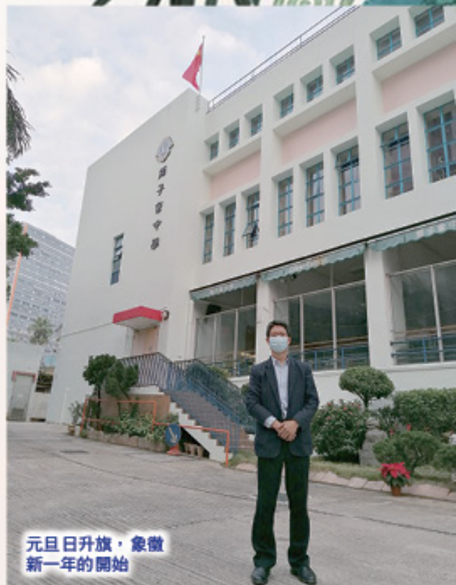
元旦日升旗，象徵新一年的開始