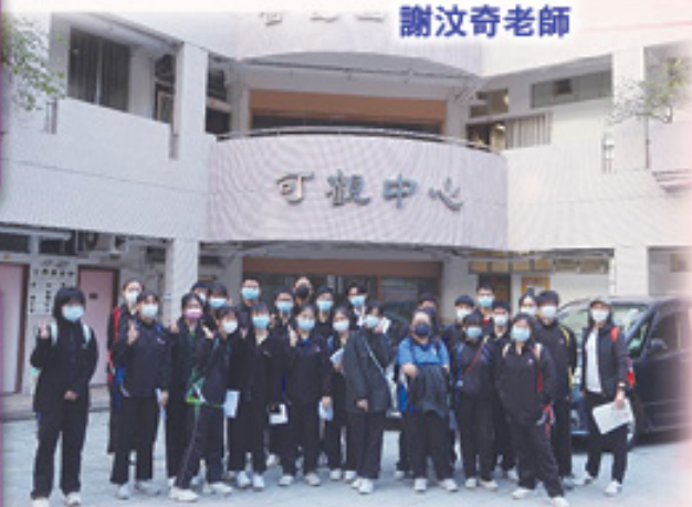
到達目的地，精神奕奕地影合照。