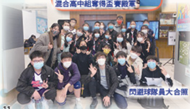
閃避球隊員大合照