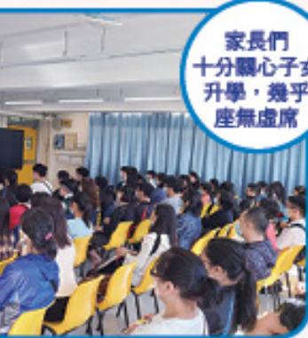
家長們 十分關心子女 升學，幾乎 座無虛席