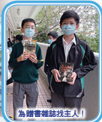
為贈書雜誌找主人!