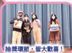
抽獎環節,皆大歡喜!