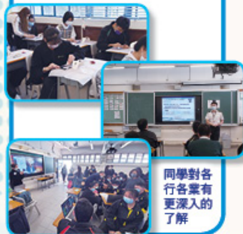
同學對各行各業有更深入的了解

參加這次講座後，令我對商務活動營運行業有更深入的認識。當天講者為我們介紹了商務活動營運行業的入行要求、日常工作、進修途徑及未來發展等。同時讓我們了解到如何能在發佈會上介紹新產品、擴大銷售渠道、增加銷售額及產品廣告拍攝的技巧等。是次活動對我有很大啟發，我體會到我需要為自己的未來好好裝備一些「軟技巧」，例如溝通能力、運用資訊科技能力、抗逆力、積極心態和解難能力等，好讓自己能迎合未來社會的發展所需。