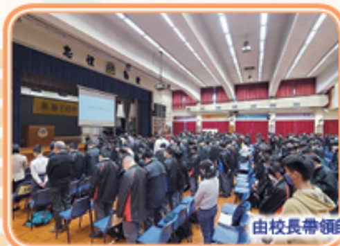
由校長帶領師生進行默哀悼念！

從 2014 年開始，國家把 12 月 13 日定為「南京大屠殺死難者國家公祭日」，當日由校長帶領一眾師生進行一分鐘默哀悼念，為當年數以十萬計的死難者致以哀悼，校長亦訓勉同學以史為鑒。隨即播放影片，讓學生認識及了解南京大屠殺的史實，加強學生的國民身份認同。最後，校方邀請了兩名修讀中國歷史科學生作分享，整個流程在莊嚴的氣氛下結束。