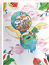
6E 陳沛茵 優異獎