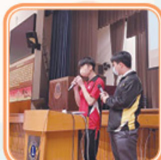
兩位修讀中國歷史科學生與我們分享歷史背景資料及個人感受！