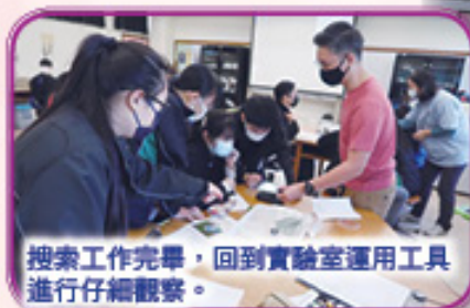
搜索工作完畢，回到實驗室運用工具進行仔細觀察。