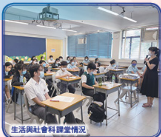
生活與社會科課堂情況

我校於本學年，為中一至中三級的同學，新開辦了「生活與社會科」。生活與社會科提供基礎知識、概念和視角，促進學生在高中各個人、社會及人文教育科目及公民與社會科的學習，幫助學生以個體和社會一份子的角度來認識自我，同時讓他們了解本地、國家及世界其他地方的經濟活動，鼓勵學生培養對本地和國家社會政治體系的意識和興趣，透過探索全球性議題和世界政治，拓展國際視野。