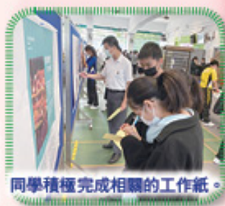
同學積極完成相關的工作紙。

老師設計文化相關展板，讓同學了解印度及尼泊爾的燈節，為同學擴闊視野，認識不同的文化，從而了解在港少數族裔的生活。展覽後亦收到超過五十張已完成的工作紙，可見同學積極參與活動。