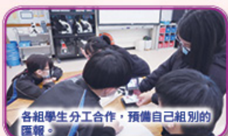
各組學生分工合作，預備自己組別的匯報。